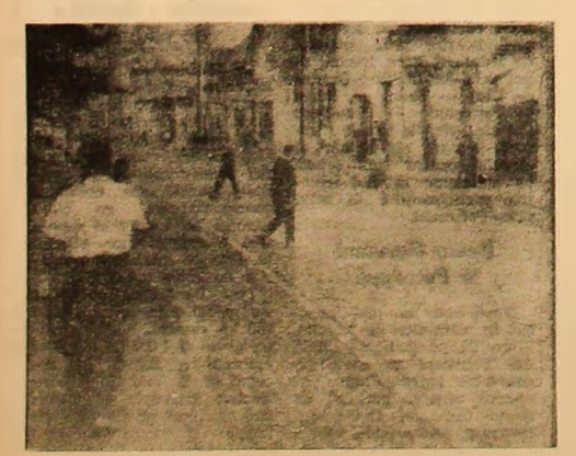
Pletoni din orașul Vulcan traversând încorect strada