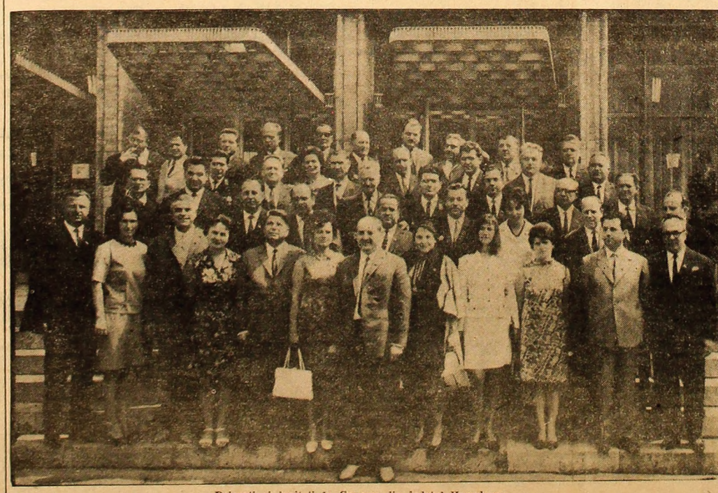
Delegați și invitați la Congres din Județul Hunedoara.