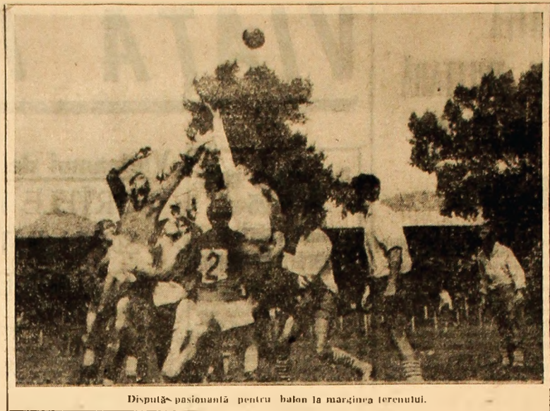
Dispută pasionantă pentru balon la marginea terenului.