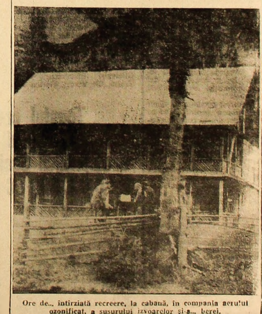
Ore de... întîrziată recreere, la cabană, în compania aerului ozonizat, a susurului izvoarelor și... berel.