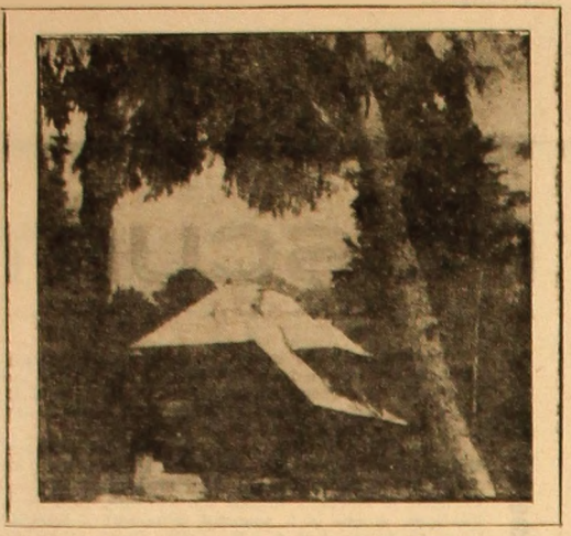
Cabana „Gura Apei”

— Mi se întîmplă lucruri eludate. Închipuți-vă că vîd tot timpul niște vovci. — Da, și ce vovci? — Nu știu, vovci cu nu auz și vovci fără.