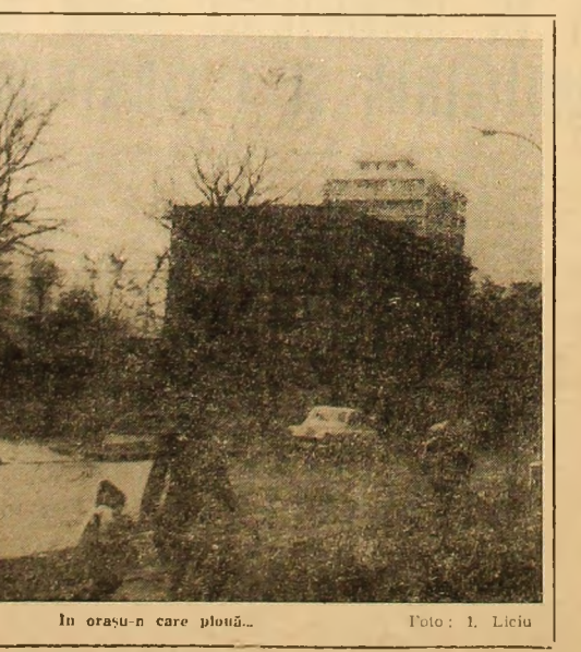
În orașu-n care plouă...

De asemenea, vor fi etalate cu această ocazie și aspecte interesante de la Congresul la care a participat la Paris dr. Iosif Esanu, cit și de la Fabrica de medicamente din Clermont — Ferrand (Franța) al căruu invitat de onoare a fost.