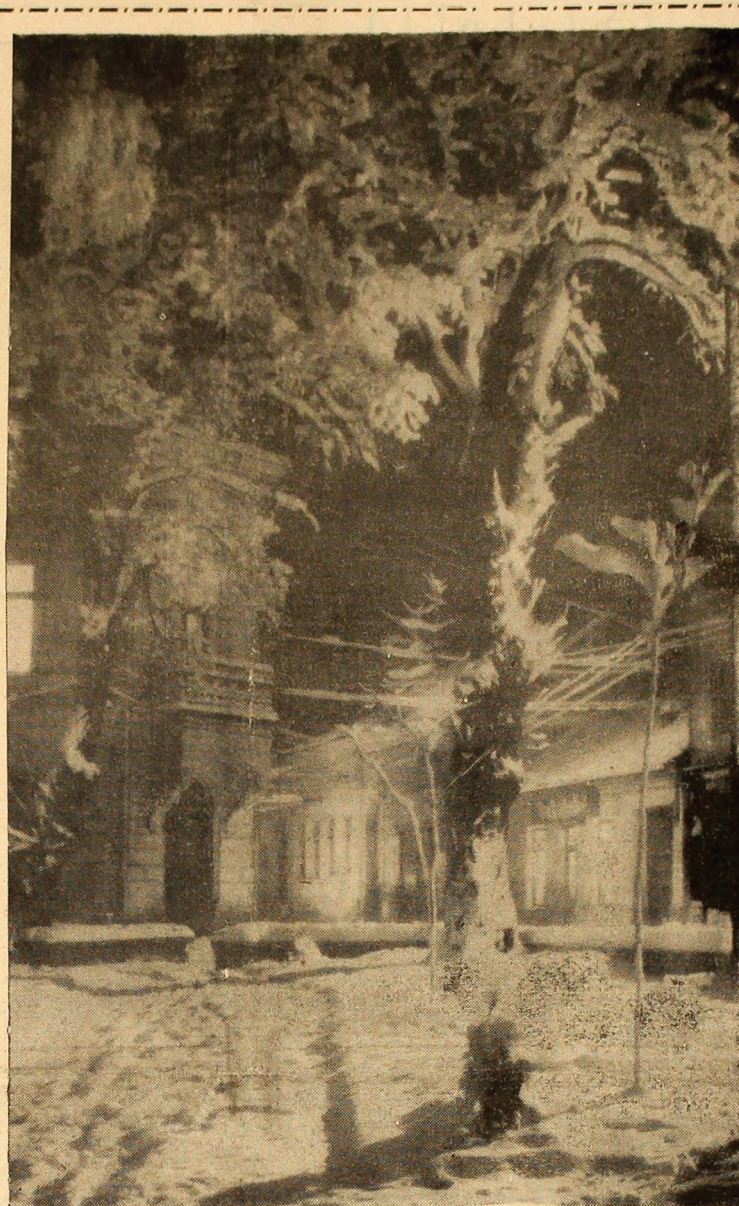
A NINS, LA PETROȘANI!