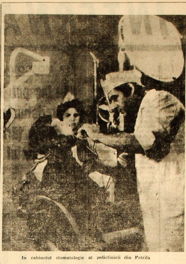
În cabinetul stomatologic al policlinicii din Petrila

Ioan Mihai din Vulcan ne scrie: „Lucieșii în blocul C 24, scară I, apartamentul 29 din orașul Vulcan, unde, de la data de 15 octombrie, nu mai primesc apă.