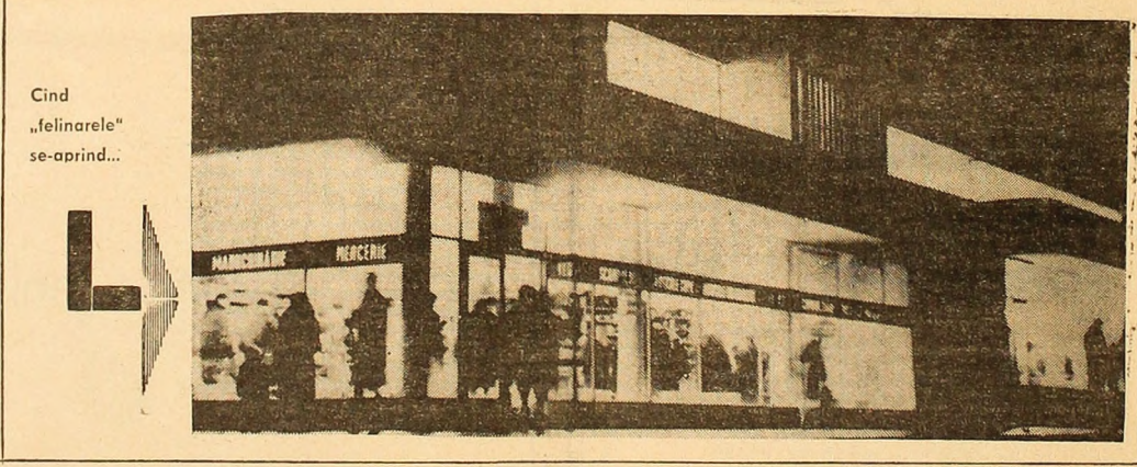
Cind „feinarele“ se-aprind...