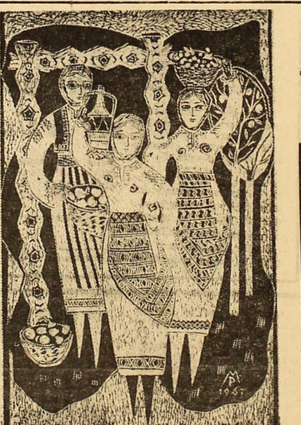
Pop MARIA cercul de artă plastică Lupeni „OBICEIURI” — linogravură

La cooperativa „Deservirea” din Lupeni, unitate unde lucrează peste 130 de salariați dintre care mulți sînt tineri, pulsează o meritorie activitate cultural-artistice. În cadrul clubului, al bibliotecii, în secții se organizează periodic acțiuni atractive cu un bogat conținut educativ și cu o largă audiență în rîndul cooperatorilor.