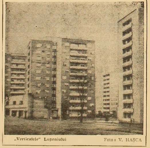
„Verticalitate” Lupeniului

La început, suportul metalic pe care l-au conceput muncitorii a sîrșit în urmă. După ce scheletul a prins contur, umirea s-a transformat într-un scepticism total. Înșiși directorul fabricii, treclînd pe acolo, l-a întrebat pe lăcătușii ce vor să facă, dar se pare că aceștia nu înțeleg neapărat să-l convingă, sau poate nu aveau timp pentru așa ceva. „Ne-ajî lăsat sarcina să executăm lucrarea, nu? Ei bine, o vom executa” — răspundea lăcătușii, siguri pe el. Apoi, preocupat de lucru, nu mai erau atenți la întrebările curiosilor.