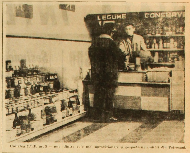
Unitatea C.L.F. nr. 5 — una dintre cele mai aprovizionate și gospodărite unități din Petroșani.