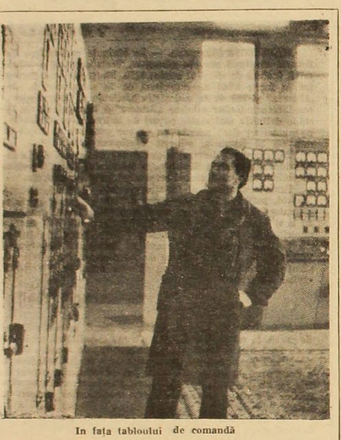
În fața tabloului de comandă

N. R. Asteplăm și răspunsurile conducerii O.C.L. produse industriale și Centrului de legume și fructe Petroșani cu privire la măsurile luate pentru îmbunătățirea aprovizionării și a condițiilor de depozitare și desfacere a produselor în localitatea Cîmpu lui Neag.