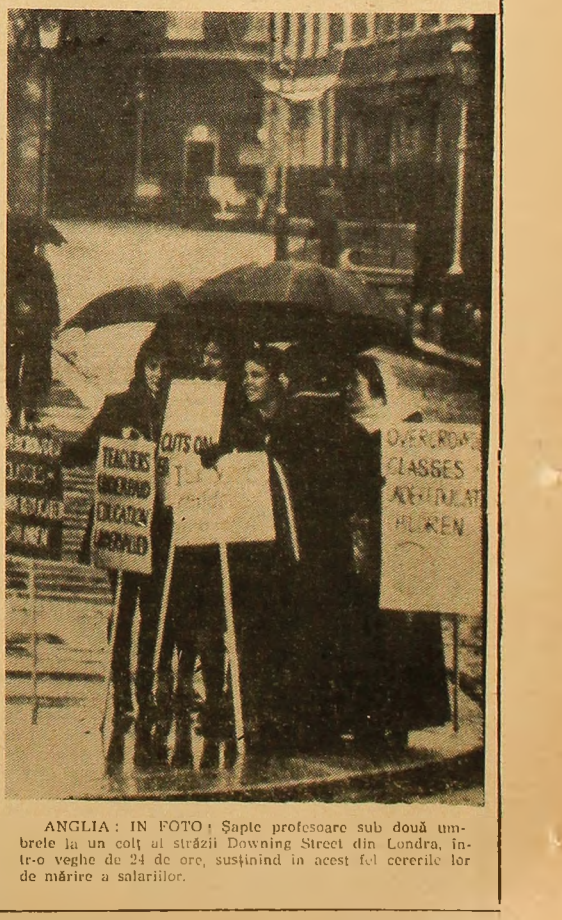
ANGLIA: IN FOTO: Șapte profesoare sub două umbrele la un colț al străzii Downing Street din Londra, într-o veghe de 24 de ore, susținînd în acest fel cererile lor de mîrire a salariilor.

LIMA. — Guvernul peruvian a anunțat că în anul 1970 va fi expropriată o suprafață de 1.470.300 ha în cadrul reformei agrare începute în urmă cu șase luni. Potrivit unor surse guvernamentale, 63.200 de familii de țărani vor fi improprietărite.