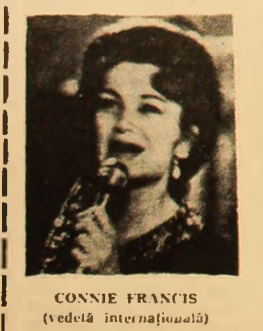
CONNIE FRANCIS (vedetă internațională)

Ieri la ora 19,45 la noua fabrică a Coroeștilor au fost produse experimental primele brichete de cîrbune. Faptul se înscrie ca o primă verificare a funcționării în plin a primei linii de fabricație a instalației și ca un moment psihologic depășit cu succes. Urmează ca după reglările și intervențiile ce se impun în continuare în circuitul fluxului tehnologic, prima linie de fabricație să-și înceapă producția de serie săptămîna viitoare.