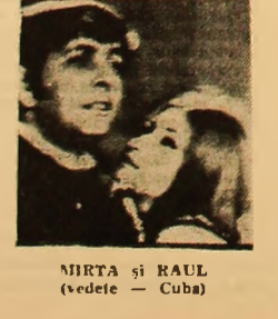
MIRTA ȘI RAUL (vedete — Cuba)