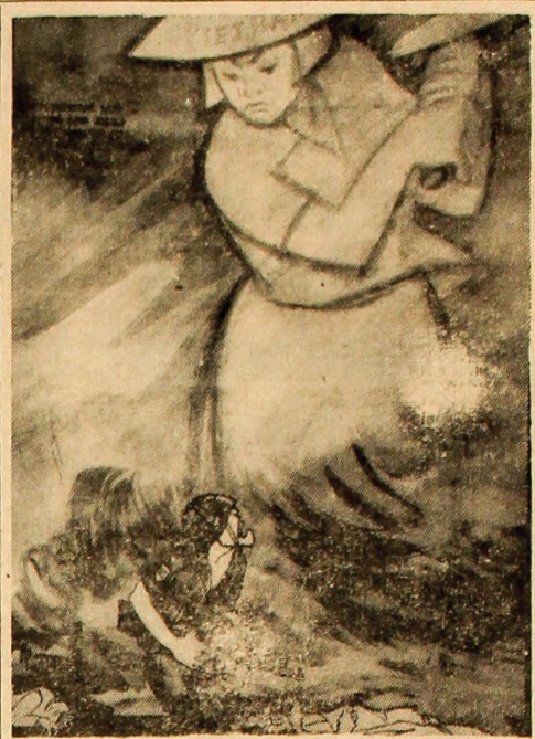
La expoziția internațională „Satira în lupta pentru pace”, deschisă la Moscova, primul loc l-a ocupat lucrarea artistică a artiștilor satirici din Leningrad „Creionul de luptă”.

Stuart Symington a declarat în Senat că ambasadorul S.U.A. în Laos, McMurtrie Godley, acțiunea în calitate de șef al statului major al forțelor militare americane din această țară, „Godley — a spus el — nu numai că supraveghează direct activitățile militare și ne-militare ale diferitelor servicii de spionaj americane din această țară, dar el stabilește, de asemenea, momentul, locul și natura activităților militare americane din Laos”. Senatorul Symington a spus că, pentru aceste motive, Departamentul de Stat a informat Senatul că ambasadorul Godley nu poate să vină în prezent la Washington pentru a fi audiat de un subcomitet care anchetează implicațiile amestecului Statelor Unite în Laos.