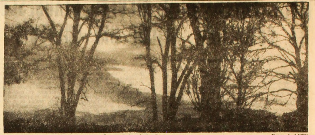
Crepusul de primăvară