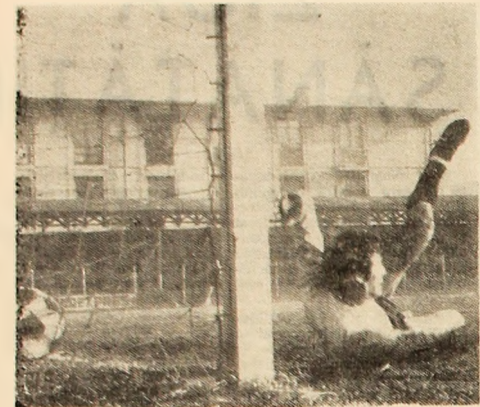
Șutul puternic al lui Libardi l-a învins pentru prima oară pe Niculescu.