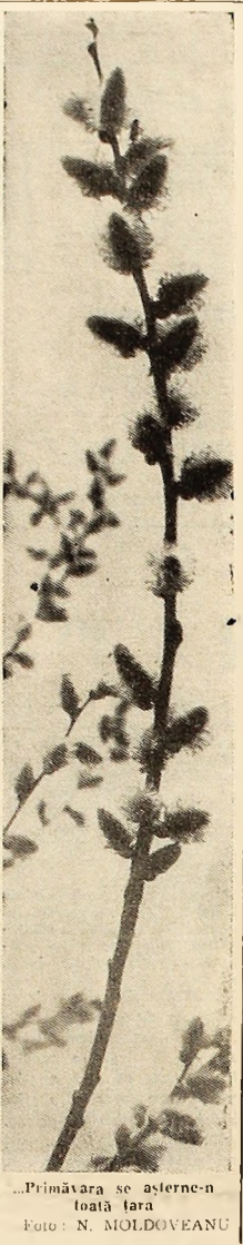
..Primăvara se aștern-n laută țara

Realizarea unei calități corespunzătoare a produselor necesită mobilizarea eforturilor oamenilor muncii pentru organizarea cit mai bună a producției, spîrirea exigenței din partea conducătorilor procesului de producție și a fiecărui salariat în parte, ridicarea nivelului de calificare și specializare. Prevederile Legii pentru asigurarea și controlul calității produselor obligă toți factorii producției la o înaltă responsabilitate pentru realizarea unor produse cu performanțe superioare în fiecare unitate economică. Considerînd îmbunătățirea calității produselor drept una din sarcinile de bază și, în același timp, o datorie de onoare, muncitorii, inginerii și tehnicienii din întreprinderile, de pe șantierele de construcție ale Văii Jiului vor munci cu abnegație pentru a încununa realizările obținute în îndeplinirea planului cu rezultate tot mai frumoase în realizarea unor produse de înaltă calitate.