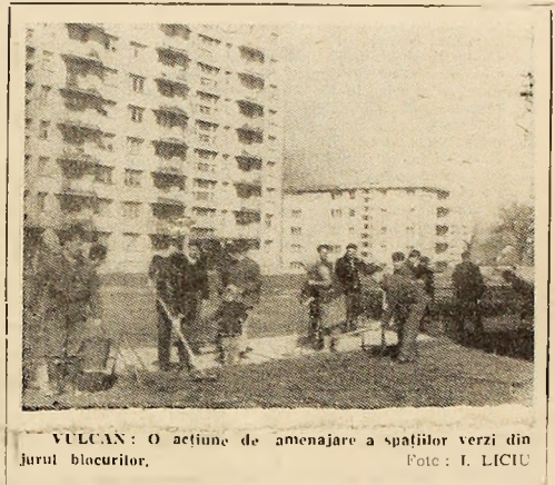
VULCAN: O acțiune de amenajare a spațiilor verzi din jurul blocurilor.

La pregătire vor participa propagandiștii din toate localitățile municipiului.