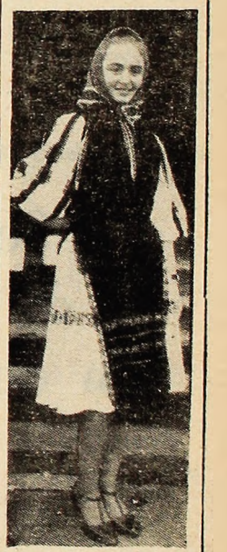
Porti ca la Banița