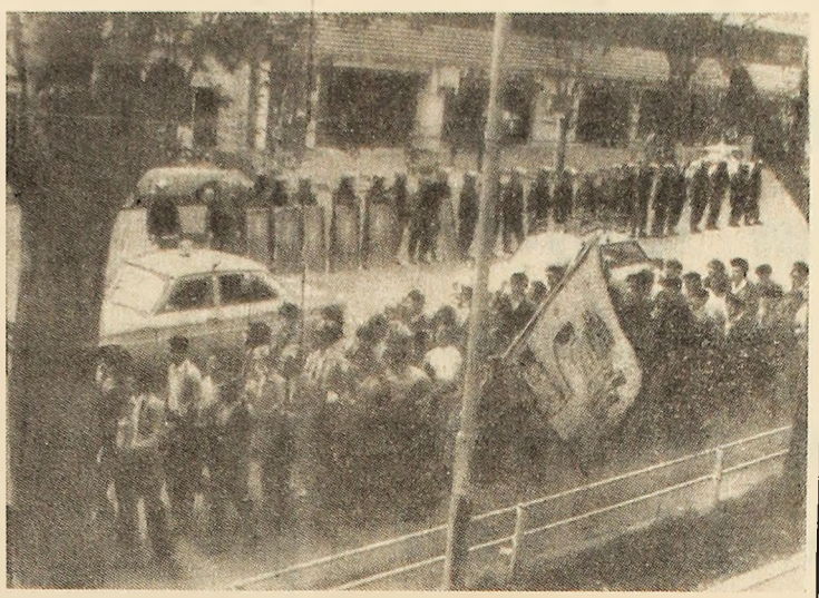
JAPONIA: Demonstrație a muncitorilor și studenților din Tokio împotriva Tratatului Japano-american și pentru retrocedarea Okinawei Japoniei.

minim. La bordul portelicopterului „Two Lima”, totul este pregătit pentru recuperare astronauților, chiar și în condiții meteorologice nefavorabile. După reușita manevrei de corectare a traiectoriei, atenția specialiștilor N.A.S.A. și a celor trei astronauți este concentrată asupra fazei finale a zborului și anume cea a reîntririi în atmosfera terestră. Programul, în mare, al acestei faze este următorul: vineri, la ora 13, Lovell, Haise și Swigert, nădrind în cabina de comandă, pentru prima dată împreună după accidentul survenit luni noaptea; la ora 15 se efectuează, în cazul în care acest lucru este necesar, o nouă manevră de corectare a traiectoriei, utilizându-se motoarele direcționale; la ora 15.30, cabina de comandă și modulul lunar se separă de modulul de serviciu; la ora 17.30, modulul lunar este, la rândul său abandonat; la ora 18, cabina de comandă pătrunde în primele straturi ale atmosferei; la ora 19.13 are loc amerizarea.