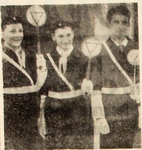
Una dintre primele patrule pionieresti de circulatie din Petrosani.