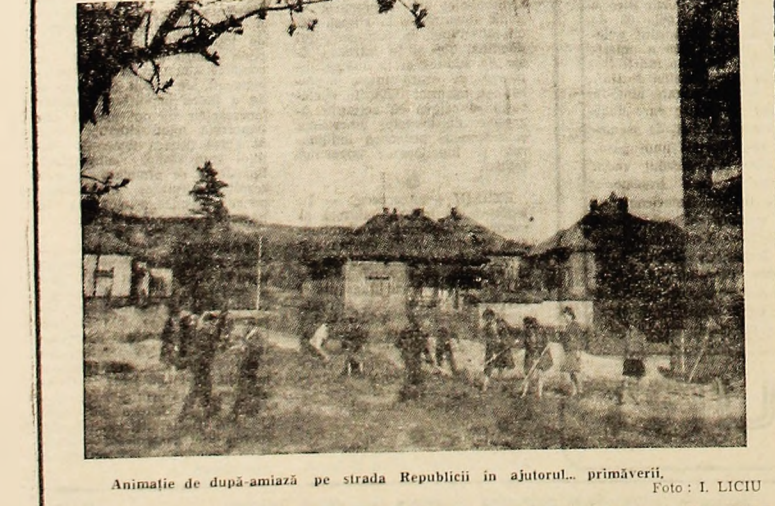
Anamie de după-amiază pe strada Republicii în ajutorul primăverii.