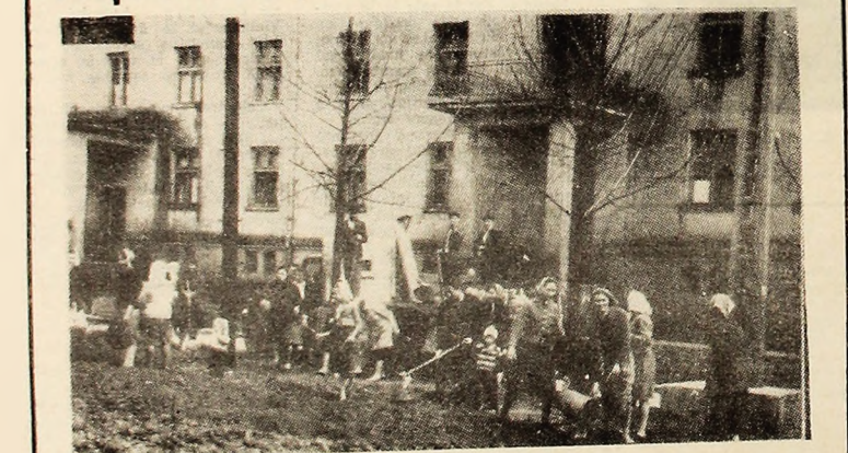
In aceste zile locuitorii cartierului '7 Noiembrie' din Petrița participă cu însufletire la acțiunile de înfrumusețare a cartierului.