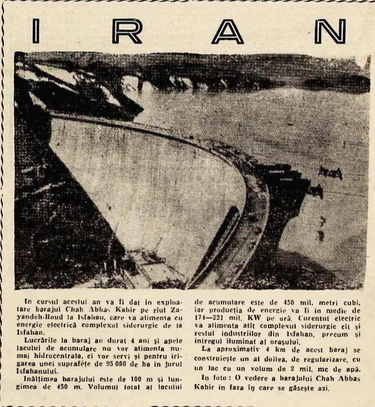
În cursul acestui an va fi dat în exploatare barajul Chah Abbas Kabir pe rîul Zayandeh-Roud la Isfahan, care va alimenta cu energie electrică complexul siderurgic de la Isfahan.

Viitoarea întîlnire va avea loc la rezidența ambasadorului sovietic, la data de 1 iulie a.c. (Agerpres)