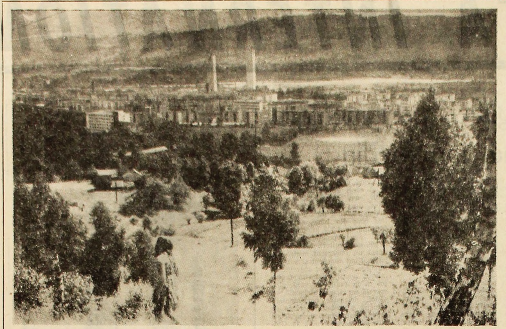
Pe pajstea însoțită