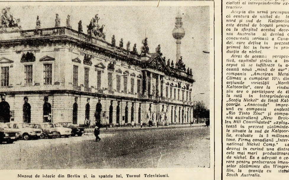
Muzeul de istorie din Berlin și, în spatele lui, Turnul Televiziunii.

Atras de această perspectivă, capitalul străin a început să se infiltreze în această nouă „mină de aur” a companiei australiene Metal Climax a cumpărat 10% din acțiunile societății „North Kalgoorlie”, care la rândul său are o participație de 49 la sută în întreprinderea „Scotia Nickel” de lângă Kalgoorlie. „Amacuda” împreună cu compania engleză „Rio Tinto Zinc” și compania australiano „New Broken Hill Consolidated” exploatează în prezent zăcămintele situate la sud de Kalgoorlie, evaluate la 5 milioane tone. Firma canadiană „International Nickel Comp.” va deveni în curînd una dintre cele mai mari producătoare de nichel. Ea a adresat o cerere pentru prelucrarea imenselor zăcăminte din Wingerlin, la granița cu statul South Australia.