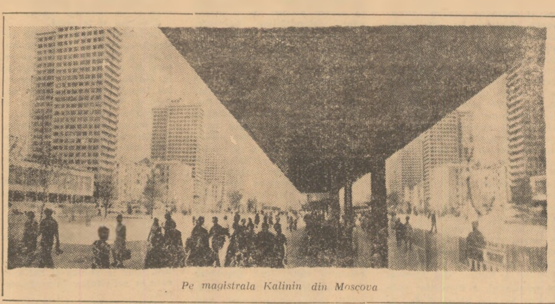
Pe magistrala Kalinin din Moscova