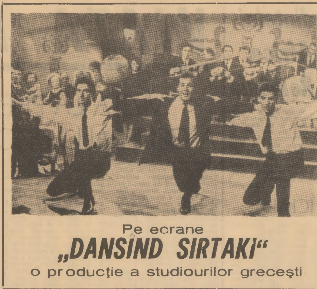
Pe ecrane „DANSIND SIRTAKI” o producție a studiourilor grecești