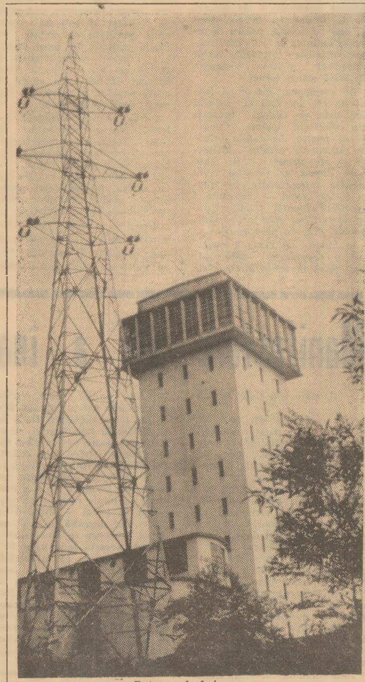
Putul sud Aninoasa