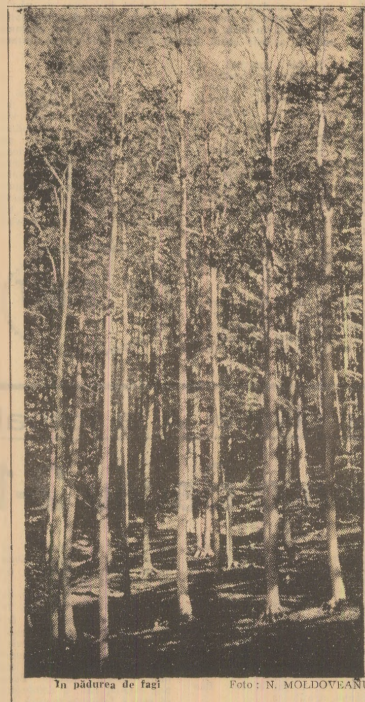
În pădurea de fagi