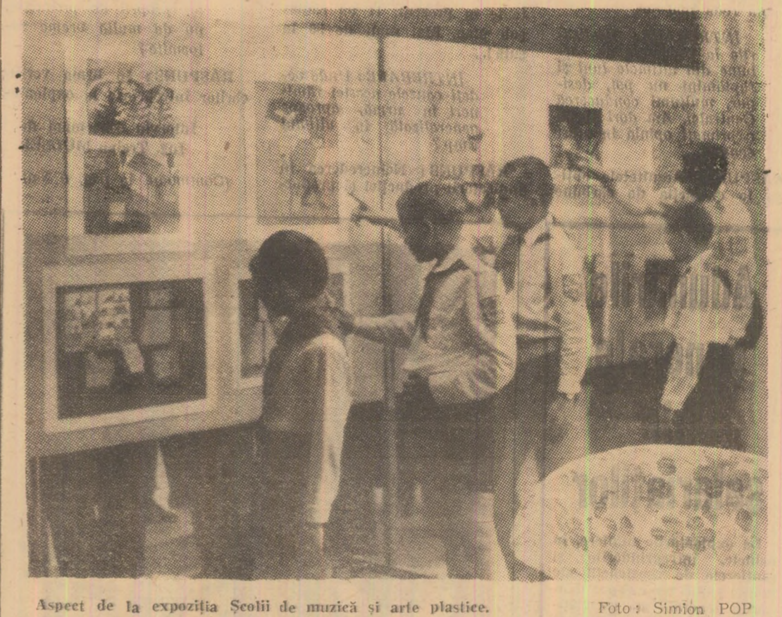
Aspect de la expoziția Școlii de muzică și arte plastice.