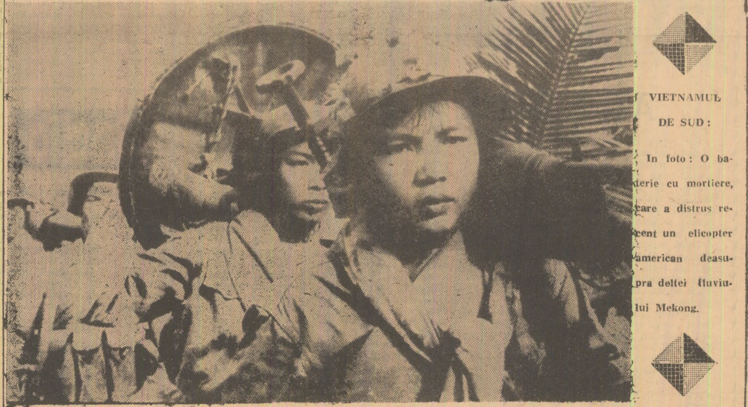
VIETNAMUL DE SUD: În foto: O baterie cu mortiere, care a distrus recent un elicopter american deasupra deltei fluviale Mekong.