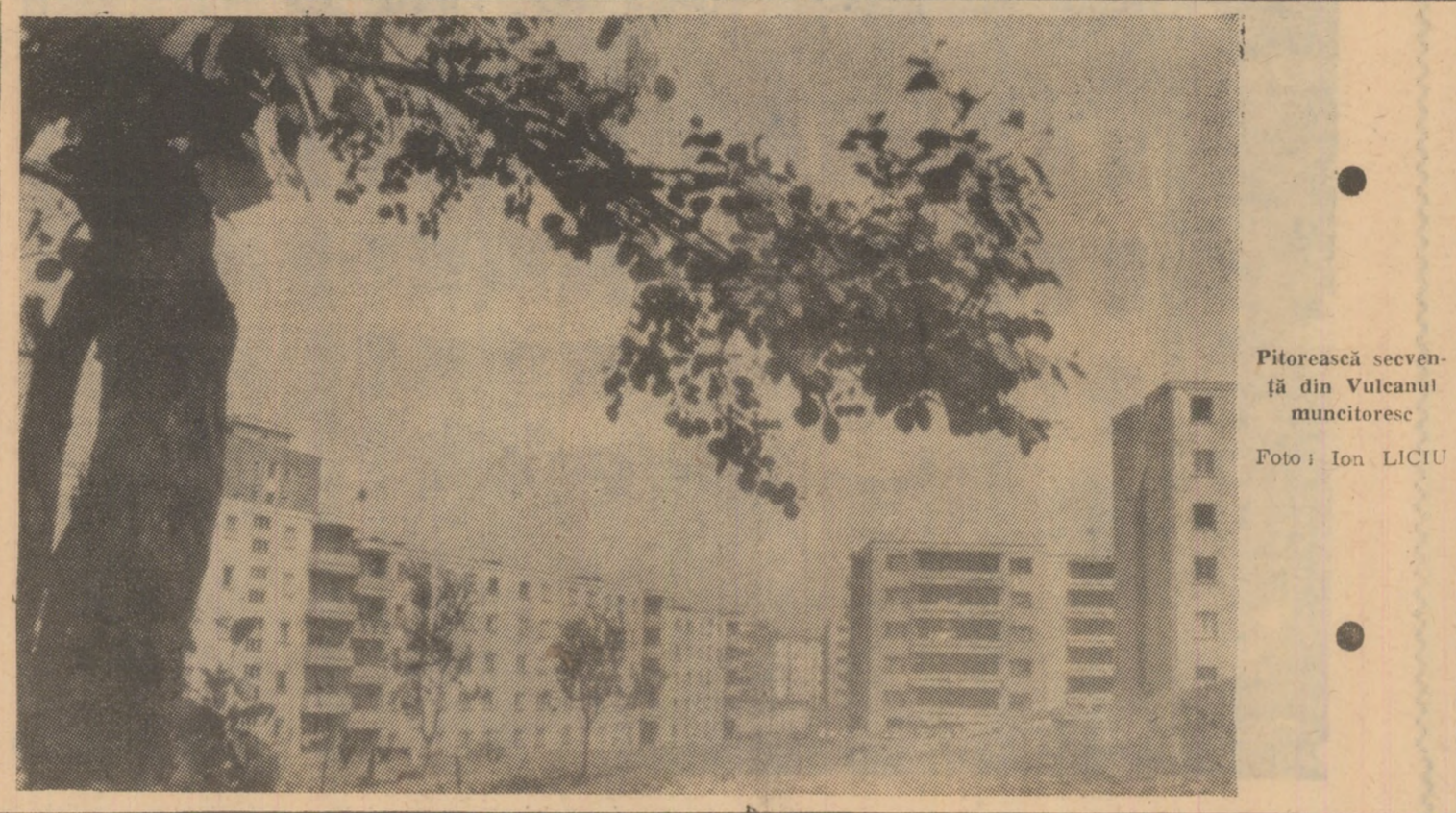
Pitorească seveș-fă din Vulcanul muncitoresc

● În cadrul Complexului de prelucrare a lemnului de la Găluțaș, s-au luat măsuri în vederea utilizării cit mai eficiente a masei lemnoase. Recent, a fost definitivat un studiu referitor la tehnologia de fabricație a unui produs cu largă utilizare în industria construcției de mașini. Este vorba de lemnul stratificat-densificat.