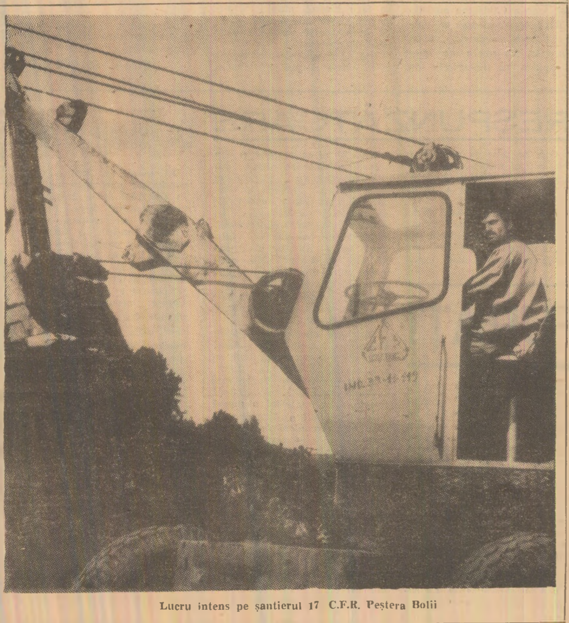
Lucru intens pe șantierul 17 C.F.R. Peștera Bolii