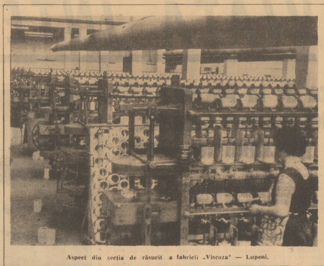
Aspect din secția de răscuit a fabricii „Viscoza” — Lupeni.