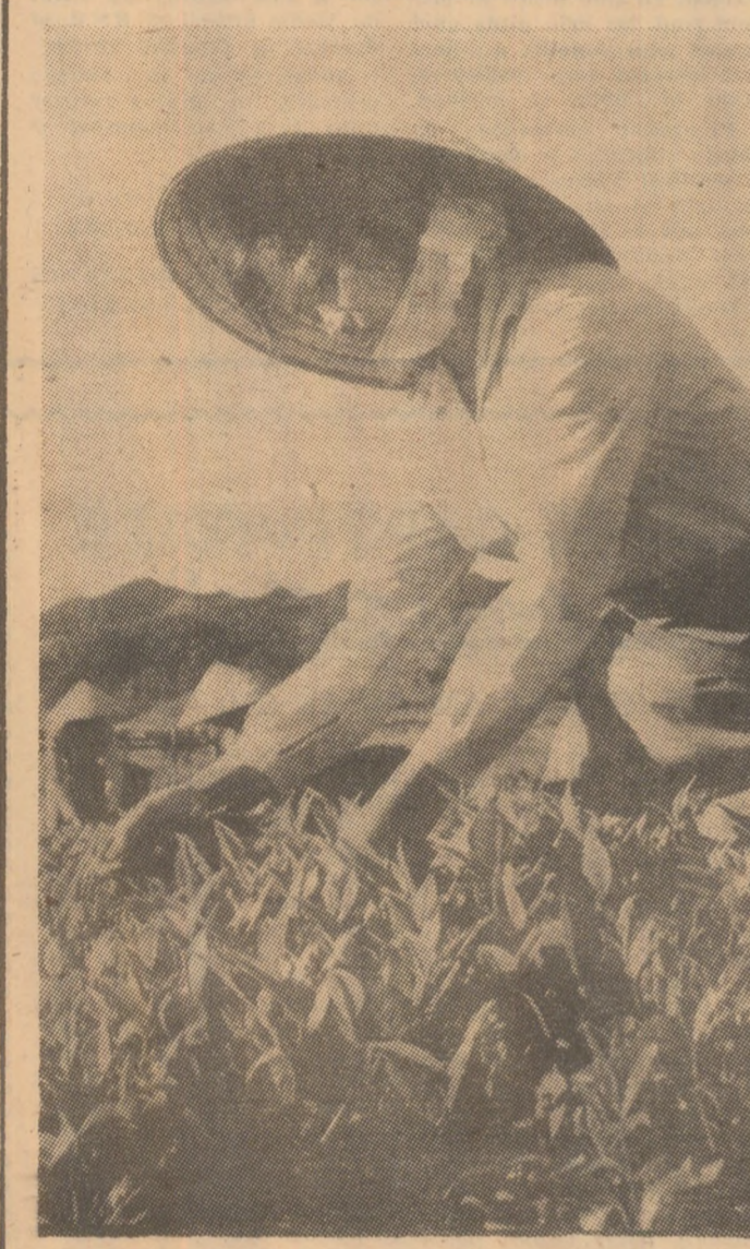
R. D. VIETNAM: Ferma de stat Moc Chau, situată la 200 km nord-vest de Hanoi, pe lângă pășuni întinse pentru creșterea vitelor, are plantații de ceai pe o suprafață de 300 ha. Ceaiul recoltat la Moc Chau este unul din cele mai bune ceaiuri vietnameze. In foto: Stringerea recoltei de ceai.