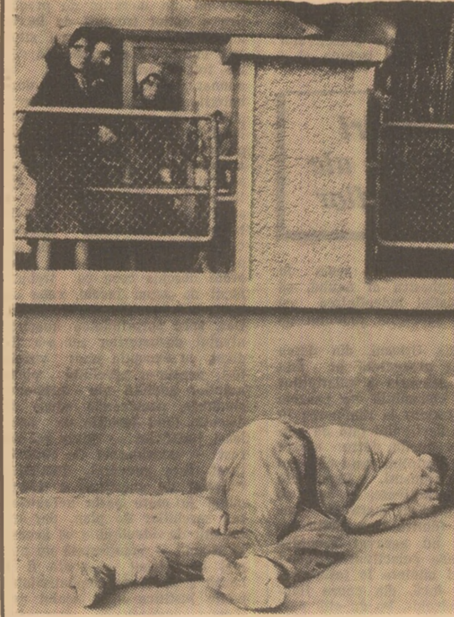
Un caz de ebrietate pe strada.