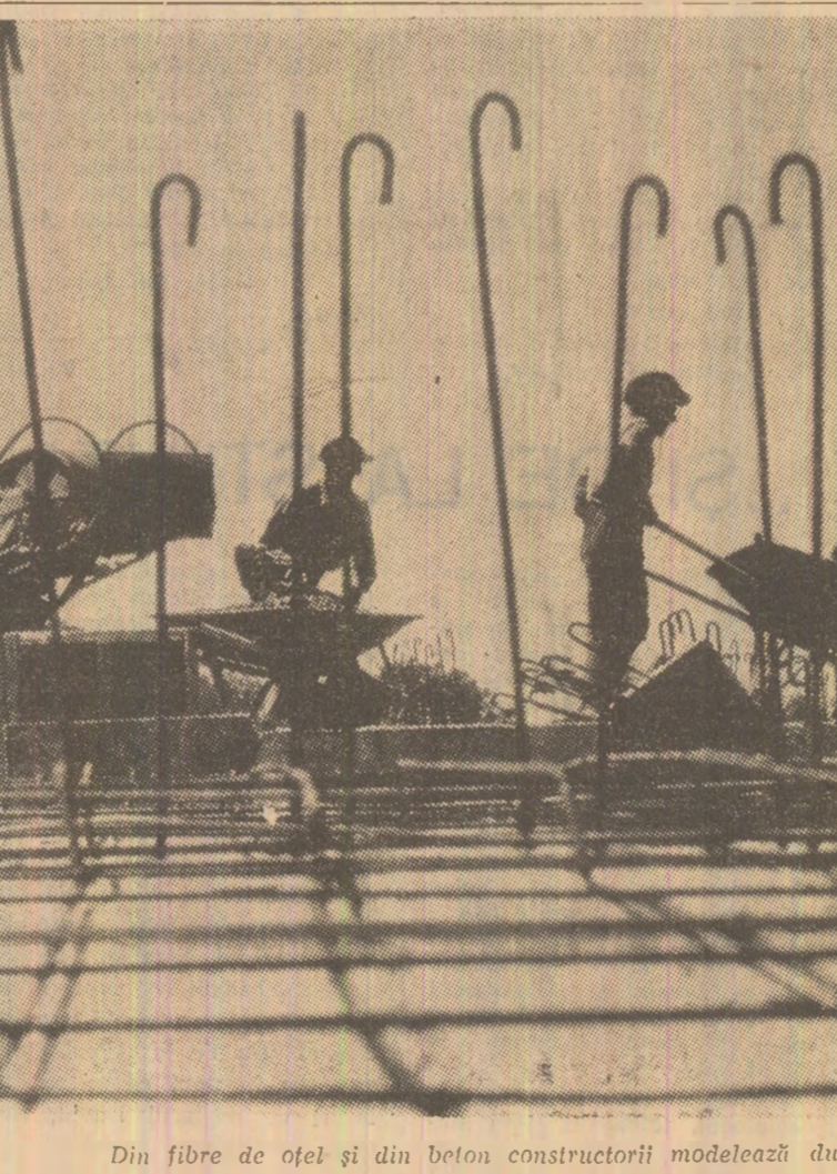
Din fibre de oțel și din beton constructorii modelează durabil și malestos prezentul.