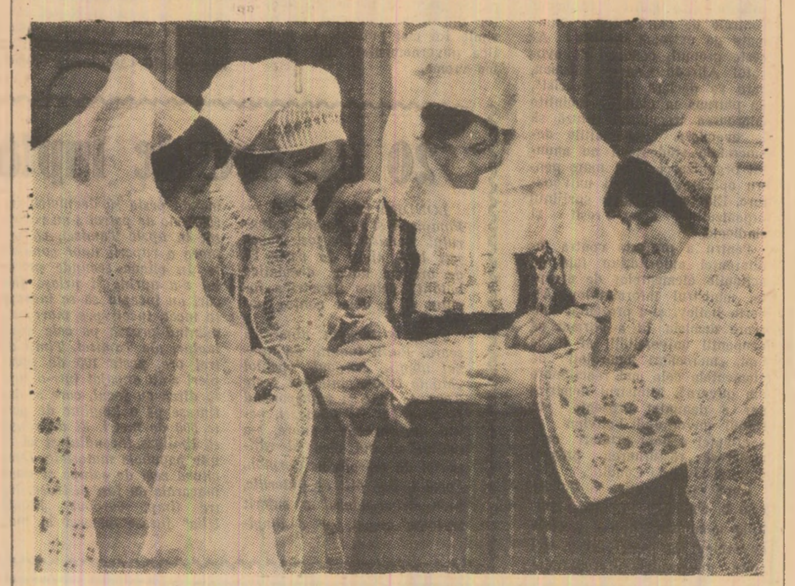
Un nou model? Să-l vedem...

Informații zilnice: la telefon I.C.H. Lotru — Invățămînt.