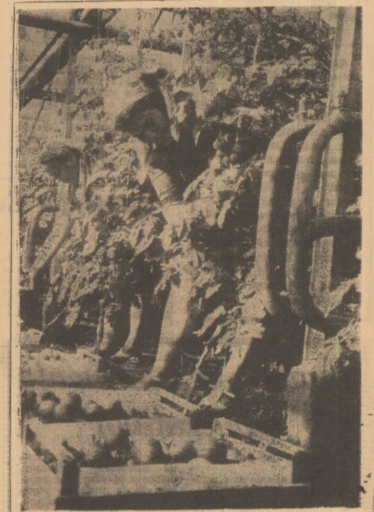
C.A.P. Bucov din județul Prahova. La cișmea de rași.