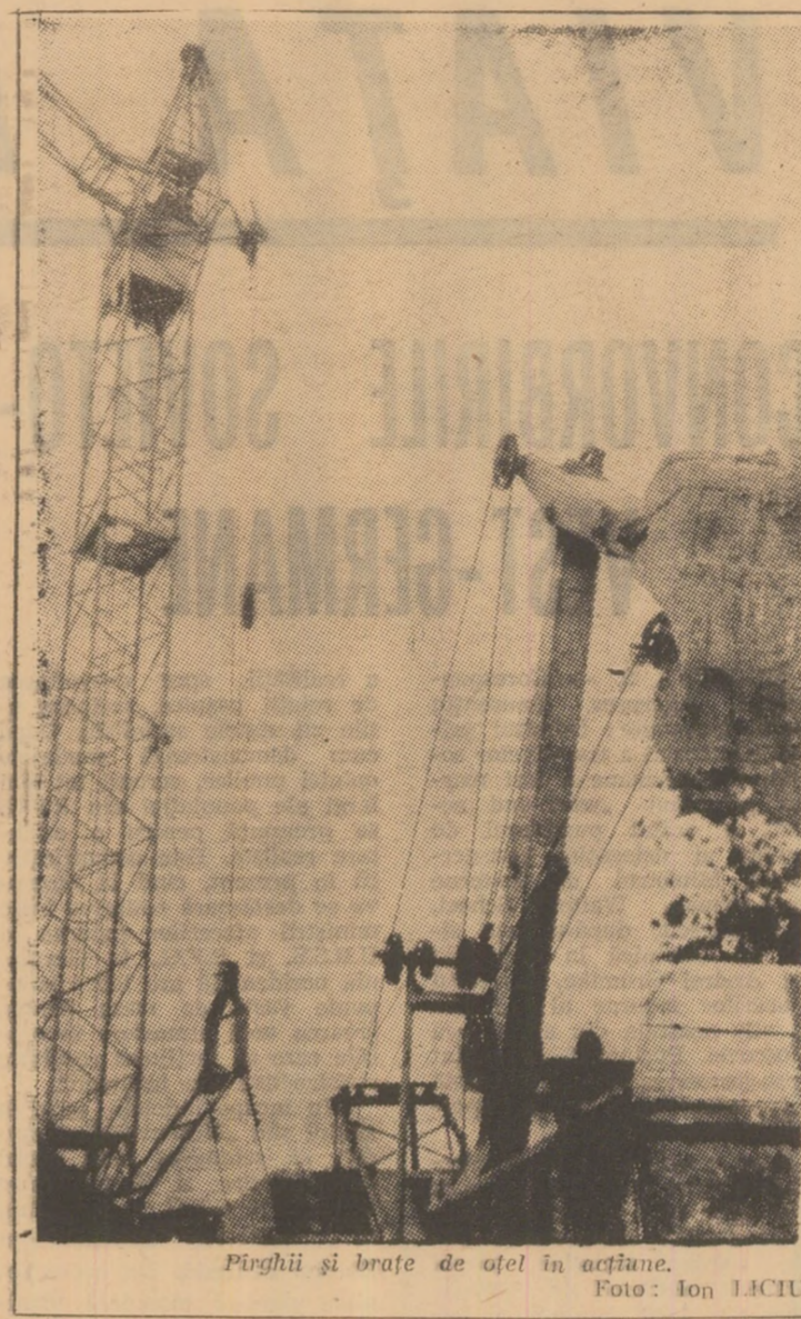
Pirghi și brațe de oțel în acțiune.