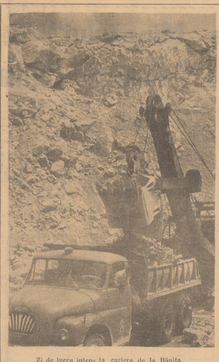
Zi de lucru intens la cariera de la Bănița.