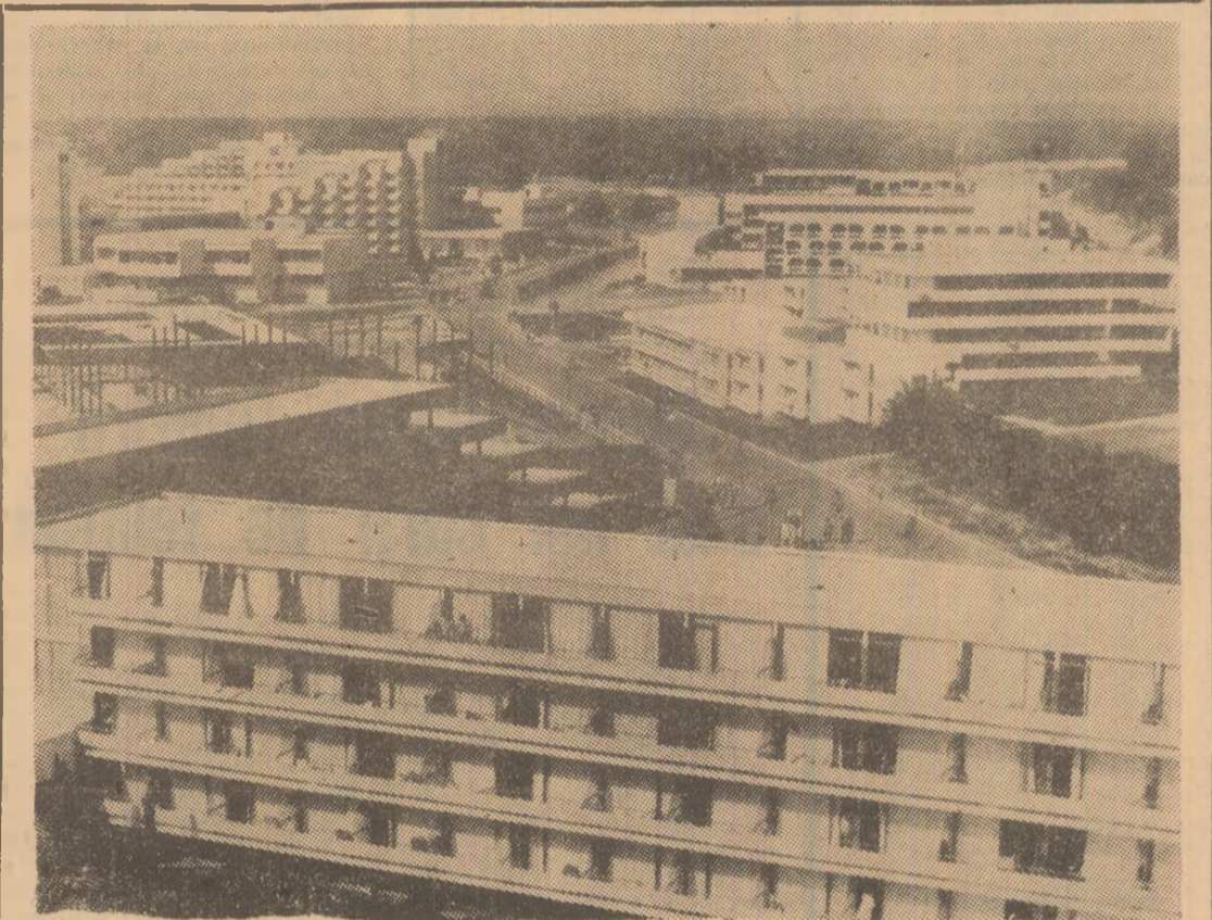
R. P. BULGARIA: Cea mai nouă stațiune pe malul Mării Negre din Bulgaria este stațiunea „Abena”...