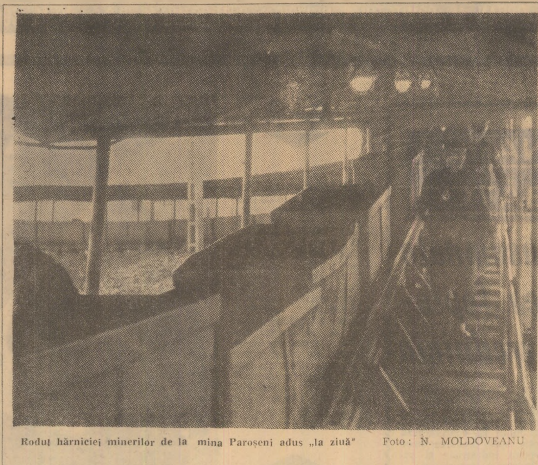
Rodu hărniceii minerilor de la mina Paroseni adus „la ziua”

sa se depista toate punctele de umezire excesivă și a se lua măsuri pentru canalizarea apelor de mină. Numai astfel încadrarea în norma internă de calitate poate deveni o realitate. Exploatărilor miniere care extrag carbune energetic, li s-a fixat și un indicator calitativ privind granulația carbunelui extras, fiindu-se în acest sens limite maxime admise pentru conținutul de carbune mărunț cu granulația 0—10 mm. În cursul semestrului I 1970, exploatarea minieră Paroseni, Vulcan și Petrița au respectat prevederile normei interne, depășindu-se însă de către exploatarea minieră Lonea — cu 5,6 puncte, Aninoasa — cu 4,5 puncte și Dilja — cu 4,1 puncte. Nerespectarea acestui indicator produce greutăți în procesul de îmbobalare la prepararea și distribuția, la un preț superior, a carbunelui livrat beneficiarilor. În această direcție, trebuie ca exploatarea menționată să stabilească măsurile necesare pentru reducerea mărunțirii excesive a carbunelui pe tot parcursul fluxului tehnologic, începînd cu elaborarea de scheme de pușcare și terminînd cu punctele de pregătire a producției la preparatie. Realizările obținute la indicatorul de calitate în semestrul I 1970, așa cum au fost arătați mai sus, impun luarea tuturor măsurilor necesare pentru ca să se respecte normele interne privind calitatea carbunelui de către toate exploatarea miniere din bazinul Văii Jiului.