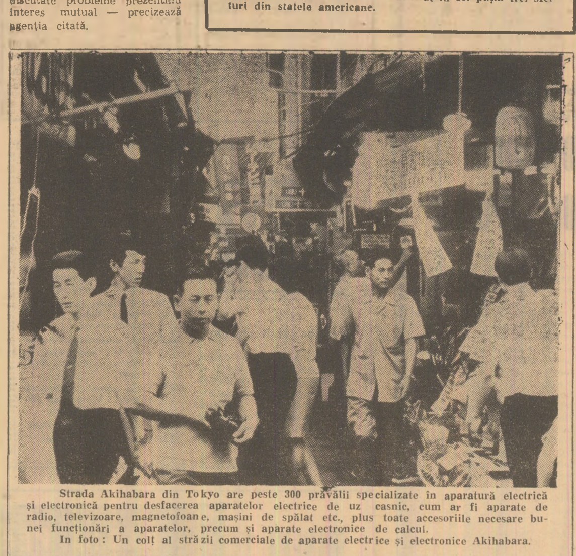
Strada Akihabara din Tokyo are peste 300 prăvălii specializate în aparatură electrică și electronică pentru desfacerea aparatelor electrice de uz casnic, cum ar fi aparate de radio, televizoare, magnetofone, mașini de spălat etc., plus toate accesoriile necesare bunilor funcționari a aparatelor, precum și aparate electronice de calcul. În foto: Un colț al străzii comerciale de aparate electrice și electronice Akihabara.

Alexei Kosighin, membru al Biroului Politic al C.C. al P.C.U.S., președintele Consiliului de Miniștri al UR.S.S., a primit marți la Kremlin pe șeful delegației irakiene, Saddam Hussein, vicepreședinte al Consiliului Comandamentului Revoluției din Irak, secretar general adjunct al Partidului Baas, anunțată agenția TASS. Au fost discutate probleme prezîndînt interes mutual — precizează agenția citată.