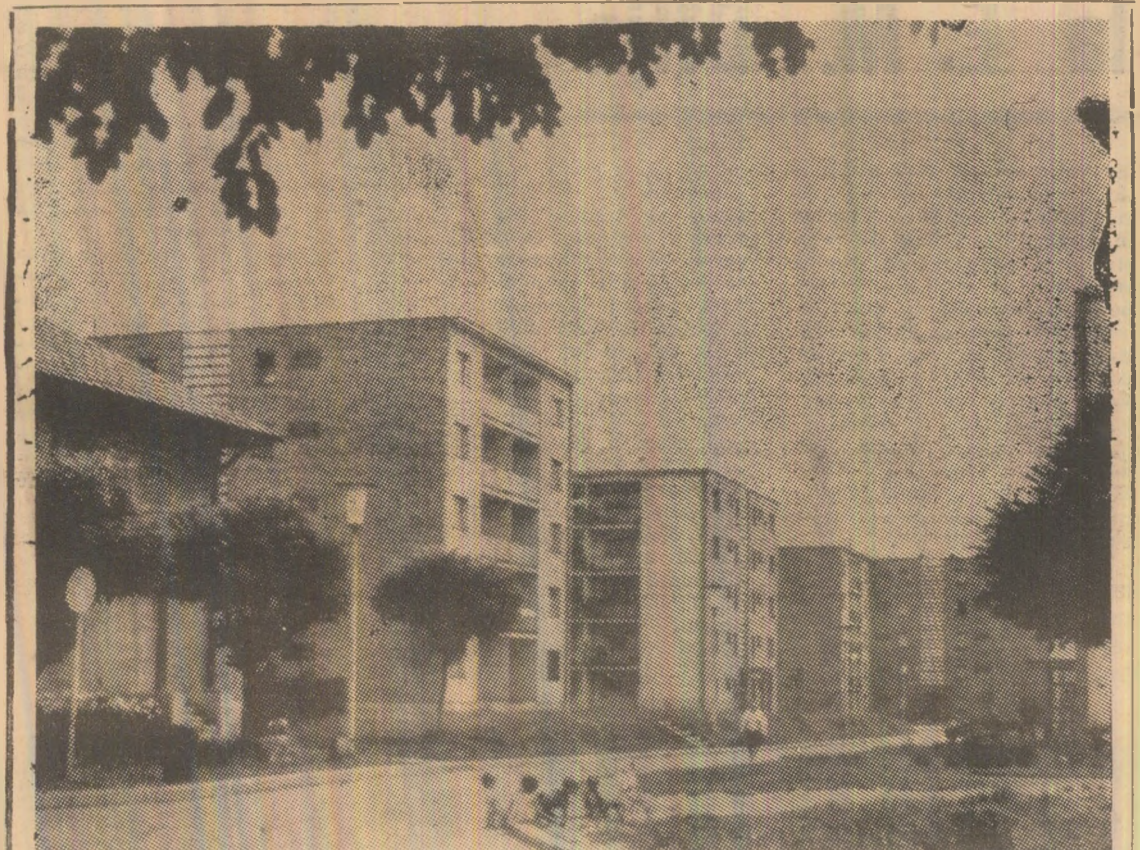
Soare în cartier