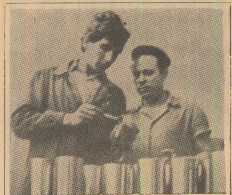
Fabrica de stîlpi hidraulici Vulcan. Fortoșul tehnic și calitatea la lucru...