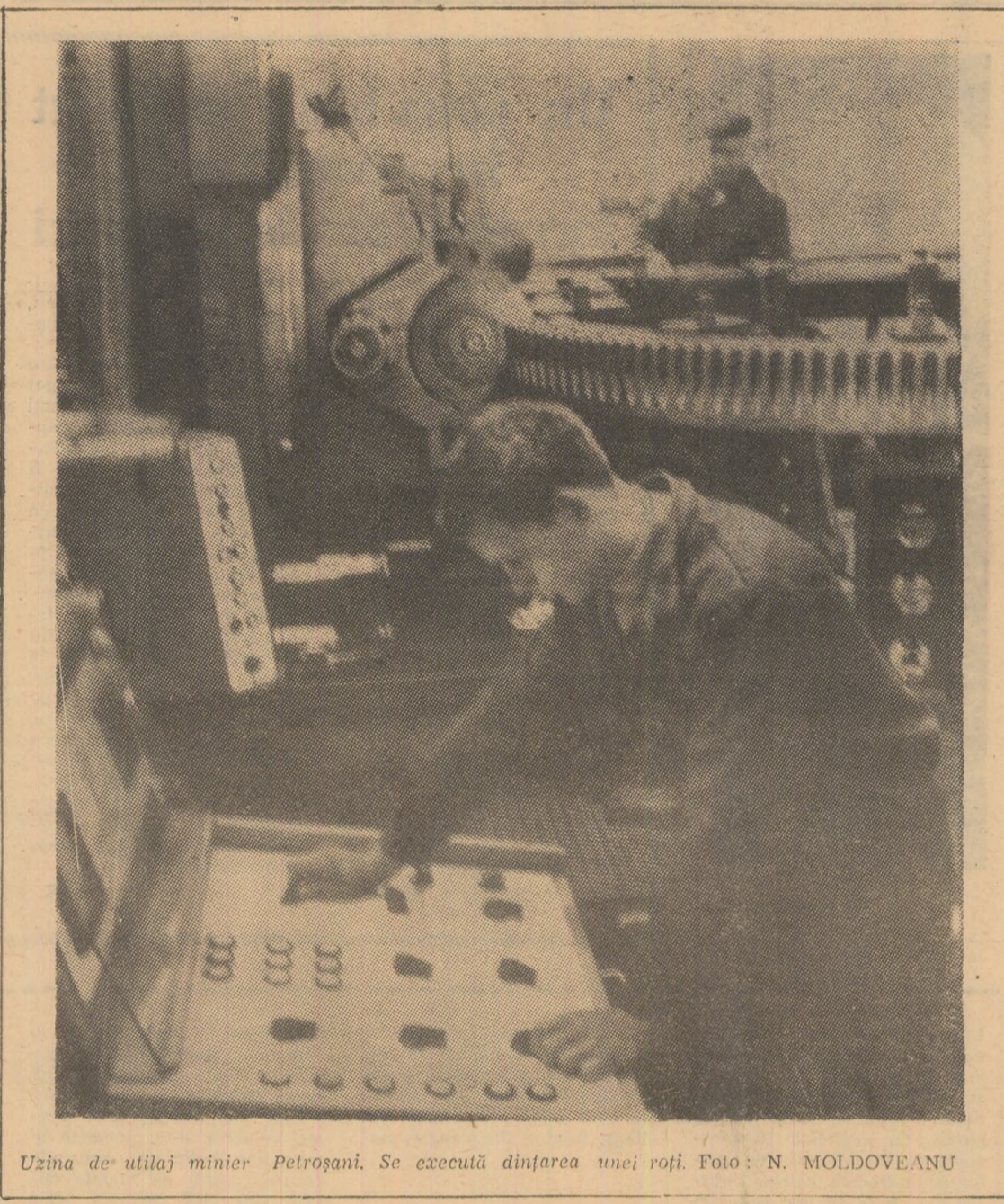
Uzina de utilaj minier Petroșani. Se execută dințarea unei roți.

TURNU SEVERIN 14. — De la trimisul special Agerpres, Marin Coandă: Monitorii și constructorii de la Porțile de Fier au trăit momentul înfăptuirii unuia dintre cele mai semnificative evenimente din istoria con-