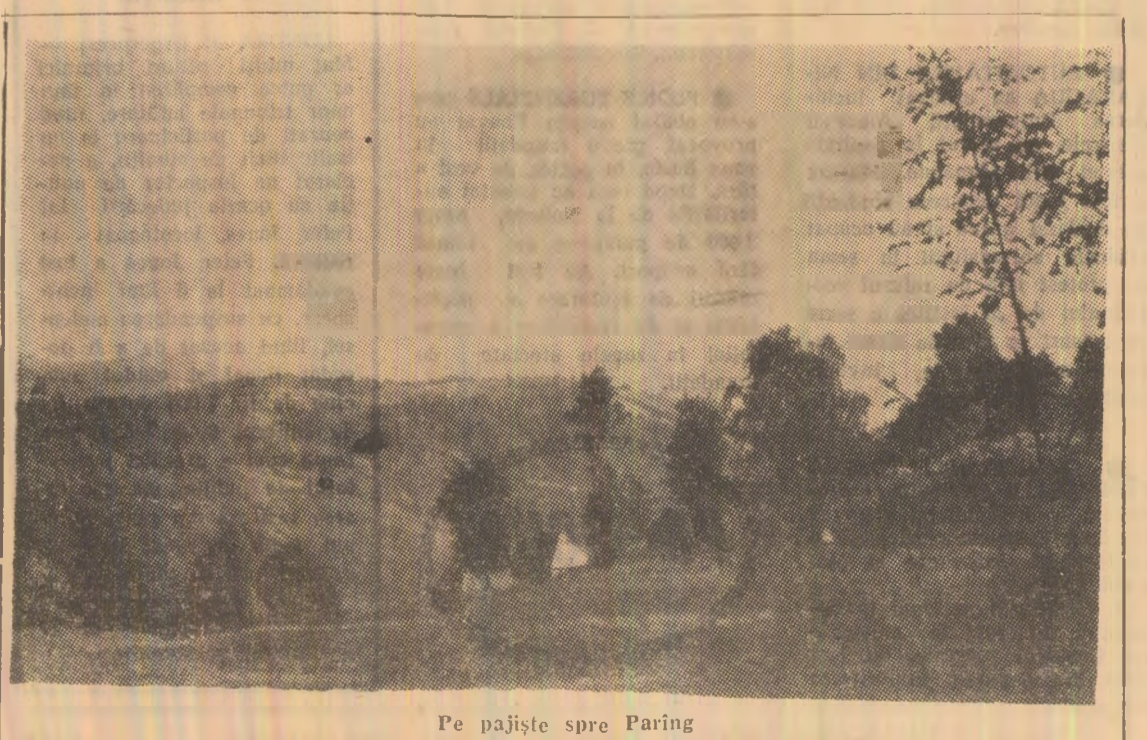
Pe pajiște spre Paring

incumștințatez pe cei interesați că organizarea calificarea la locul de muncă prin cursuri de scurtă durată, conform H.C.M. 159/1969 pentru meseriile de lăcătușii și țiglari. CONDIȚII: — să aibă vârsta între 14—30 ani — să fie absolvenți a 8 clase elementare — să aibă domiciliul permanent în Petroșani Solicitanții vor depune la serviciul personal-administrativ al I.I.L. Petroșani pînă la 8 septembrie 1970 următoarele acte: — cerere de înscriere — angajament cu vor lucra după calificare cel puțin 5 ani în cadrul I.I.L. Petroșani — fotocopia actului de studii — copia certificatului de naștere — consimțămîntul scris și legalizat al părinților pentru cei ce au vârsta sub 16 ani Informații suplimentare se pot primi la serviciul personal-administrativ al întreprinderii, telefon 1475.