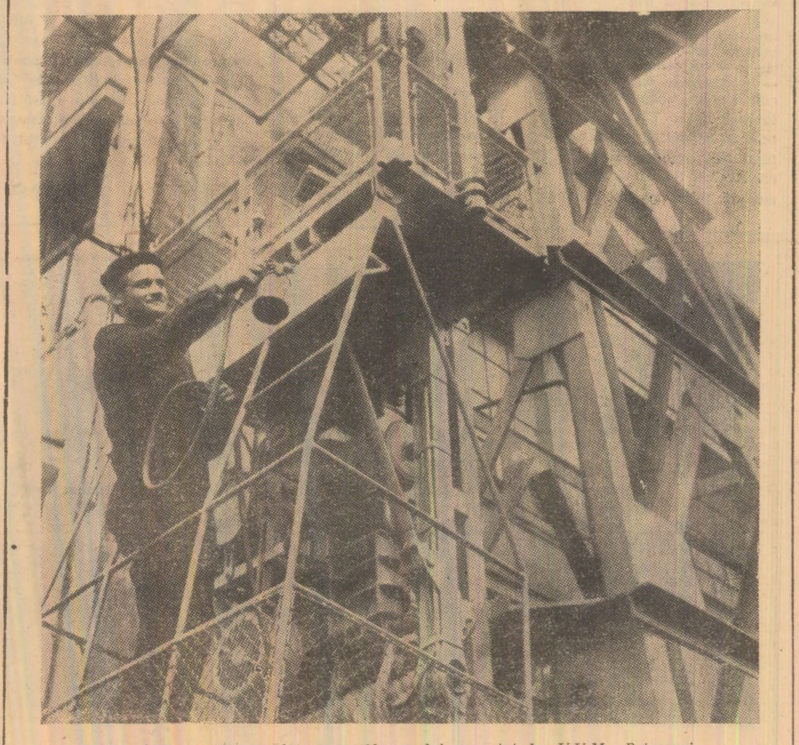
Ultima fază — de vopsire — a Alemaului executat la U.I.M. Petroșani