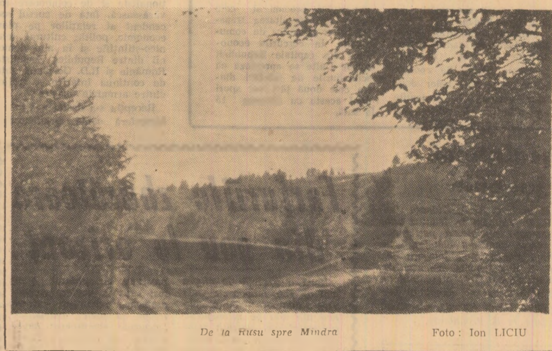
De la Rîsu spre Mîndra

Pe cînd o nouă experiență: zahăr fără cafea? C. P.