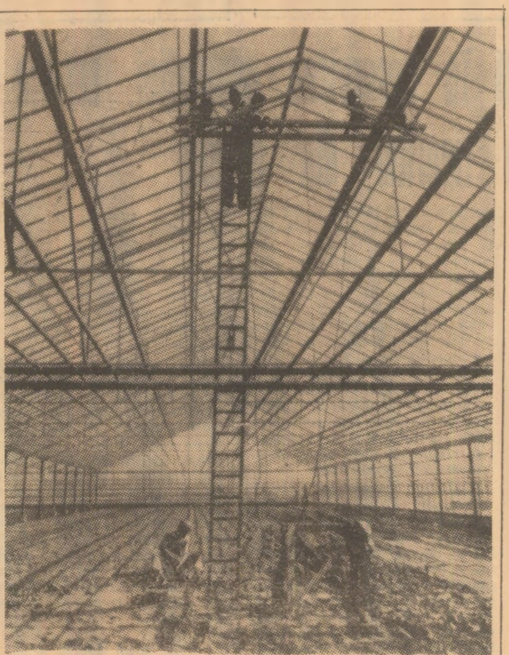
R. P. UNGARĂ: În localitatea Budakalasz din nordul Ungariei a fost construit cel mai modern tip de seră din Europa centrală. În foto: Aspect din timpul lucrărilor de asamblare a acoperișului serei.

MOSCOVA 4 (Agerpres). — Zgomotul tracoarelor și buldozerelor a trezit din somnul mult milenar un cimitir de mamuți, situat pe o întindere de cîteva zeci de kilometri în nordul taikului. Cu ajutorul unor jerturi puternice de apă pămîntul înghețat este îndepărtat pe ramășițele uriașelor mamifere care au trăit în această zonă în urmă cu 9-10 mii de ani. În același loc, oamenii de știință au descoperit rămășițele unor așezări omenești.