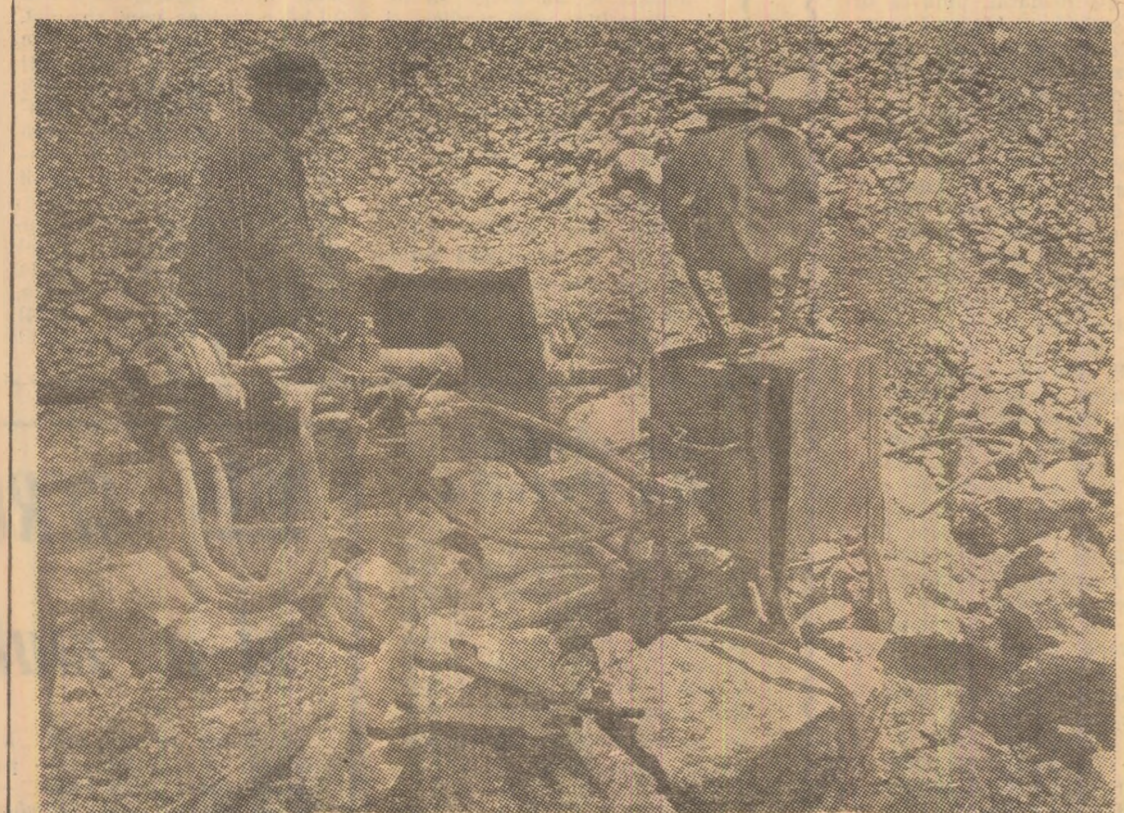
La cariera Bănișa se pregătește o nouă... discolare

97 de echipaje au împănjenit cu itinerariile lor în trecut cuprinsul țării, de pe virful Moldoveanu și pînă în Delta Dunării au rîsunat glasurile zgolbi ale pionierilor și școlărilor plecați în drumetie. Rînd pe rînd cele 97 de echipaje își încheie itinerariile aducînd cu ele jurnale care consemnează fidel activitatea expedițiilor, impresii de neuitat care vor fi povestite părinților, fraților, colegilor de școală. Turismul va cîștiga noi prieteni care se vor bucura la