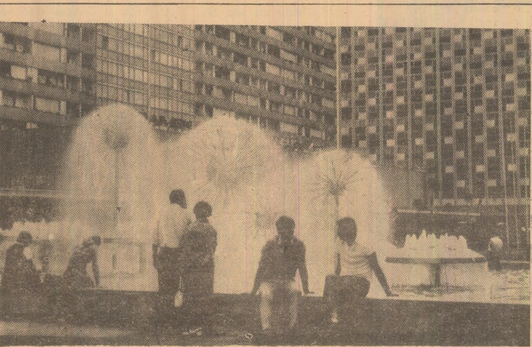
R. D. GERMANĂ: Strada „Praga” din Dresda, care a fost distrusă parțial în timpul celui de-al doilea război mondial, a fost în ultimii ani supusă unor intense lucrări de refacere și amenajare, devenind în prezent un punct de atracție pentru turiștii din țară și străinătate. În foto: Citeva arteziene asemănătoare unor uriașe păpădii (în prim plan).