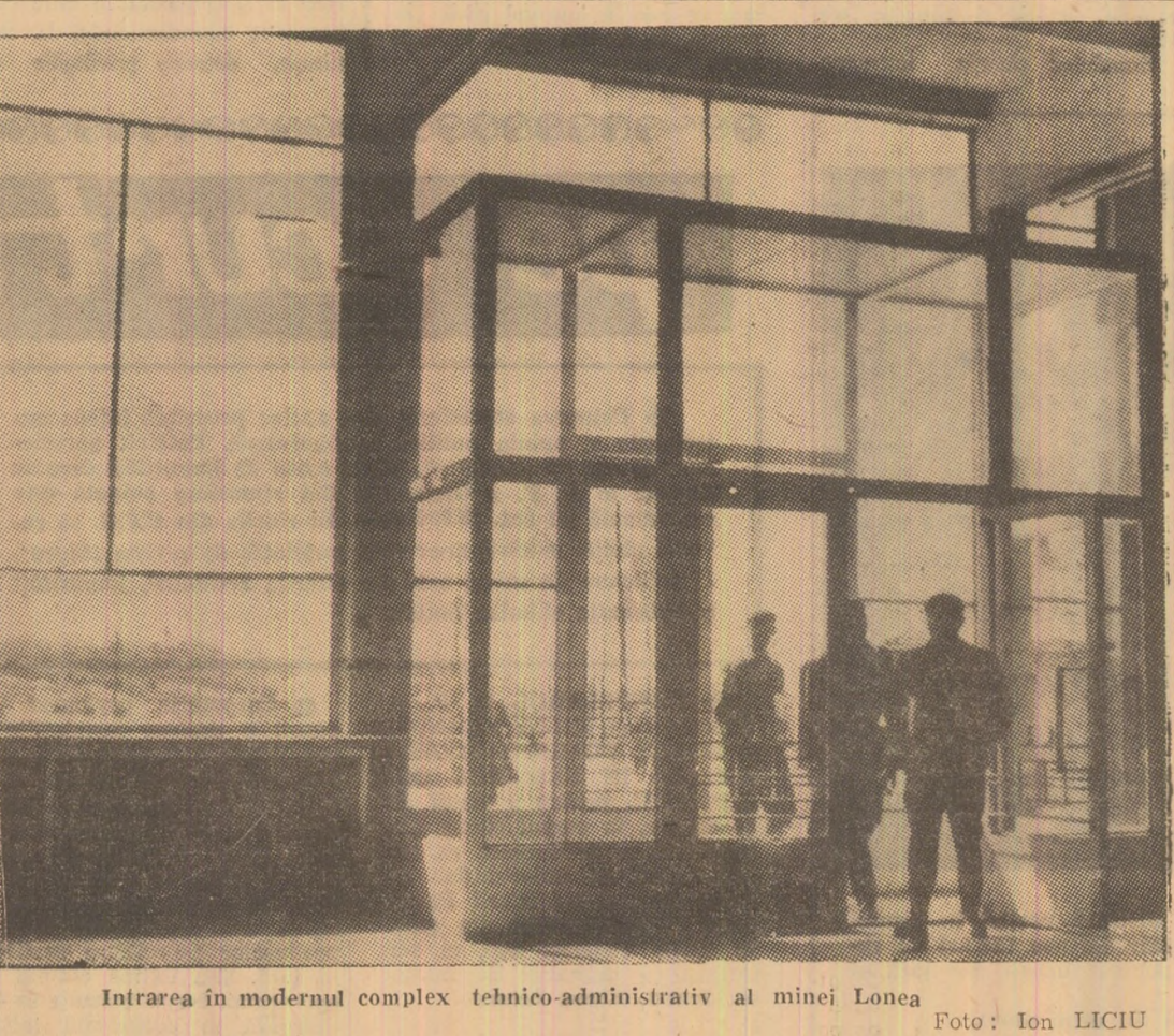
Intrarea în modernul complex tehnico-administrativ al minei Lonea.