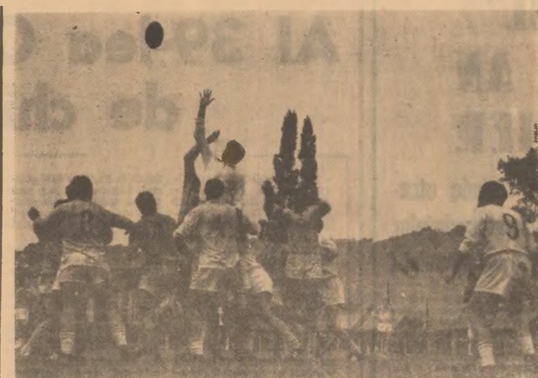
Studentii câștigă un balon la tușă