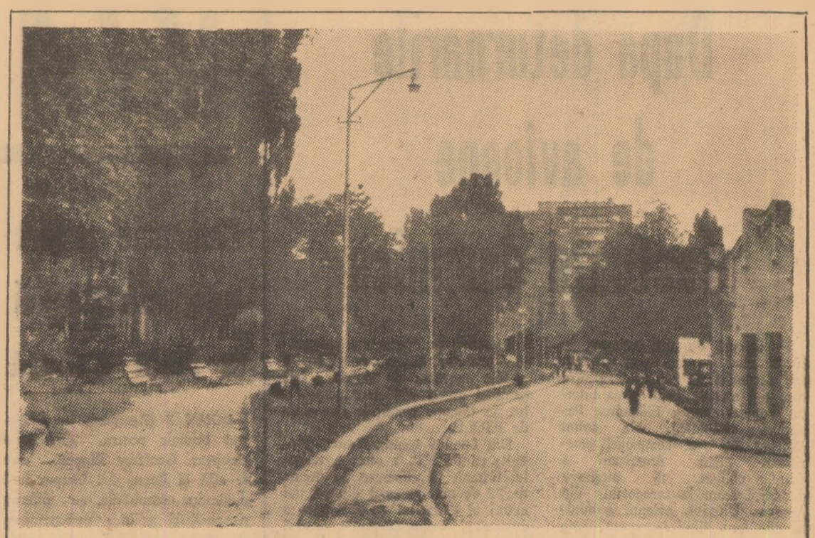
LUPENI: Băncile din parc au din zi în zi tot mai puțini amatori; vine toamna.

Prima ediție a Tîrgului Internațional București va funcționa o perioadă de numai 12 zile. De aceea este necesar ca toți cei care doresc să se numere printre vizitatorii să se înscrie din timp. Este un prilej deosebit de a cunoaște mai profund realitățile obunete de poporul român în anii socializării și totodată de a face o excursie instructivă și agreabilă în Capitala patriei noastre dragi — București.