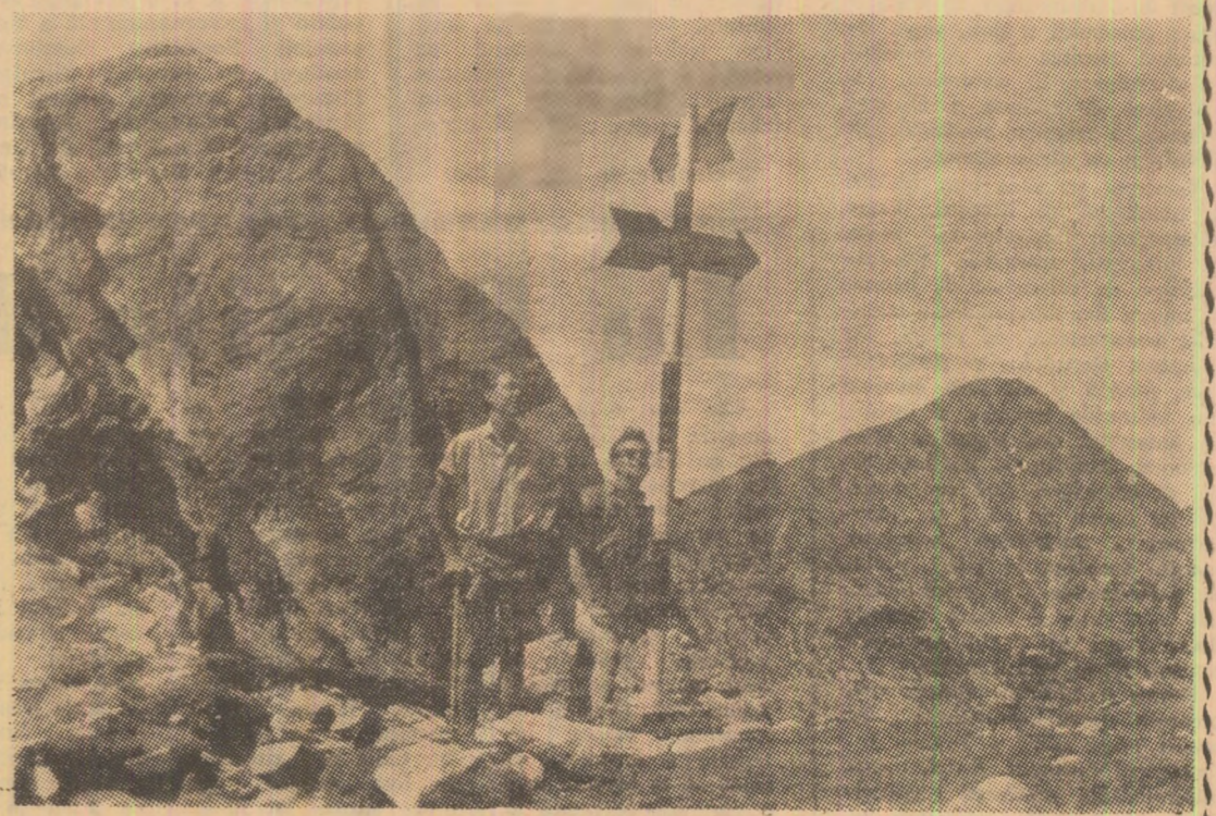
Un scurt popas în fața marșalului, apoi... mai departe