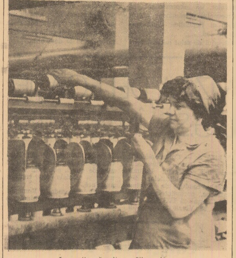
În secția răsucit a „Viscozei”

● Cursa automobilistică internațională desfășurată pe circuitul de la Nurburgring, în prezența a peste 100.000 de spectatori, a fost câștigată de sportivul englez Vic Elford, care, la volanul unei mașini „Chevron 16 Ford”, a parcurs 500 km în 3h09'07" (medie o-gară de 159.500 km). Pe locurile următoare s-au clasat Merzario (Italia) și Kinnunen (Finlanda) — ambii pe mașini „Abarth”.