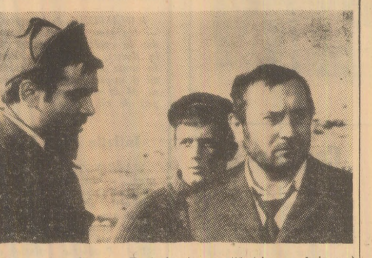
Cadru din filmul „Explozie în munți” (cinema Aninoasa)

● La cinematograful „Republica” din Petroșani, între 10 și 13 septembrie, va rula filmul francez de artă „JURNALUL UNEI CAMERISTE”, realizat de prestigioșul regizor spaniol Luis Buñuel (să ne amintim de „Viridiana”). Protagonista filmului este cunoscuta actriță franceză Jeanne Moreau. ● La „7 Noiembrie” din Petroșani, începînd de mâine, filmul „ACEASTĂ FEMEIE” cu Sarita Montiel. Cum ne-am obișnuit, actrița va interpreta tot rolul unei cîntărețe spaniole cu o viață zbuciumată. Acuzată de a-și fi asasinat iubitul și cercetîndu-se circumstanțele în care fusese comisă crima, Soledad Romero (Sarita Montiel) își va poartă viața. Intriga, lineară și deosebit de sentimentală, se va sfîrși cu un happy-end: eluciat și mișcat de povestea tragică, tribunatul decide achitarea nefericitei Soledad. „Această femeie” este o melodramă construită în mod special pentru Sarita Montiel care excelează în astfel de filme mult gustate de o mare parte din public.