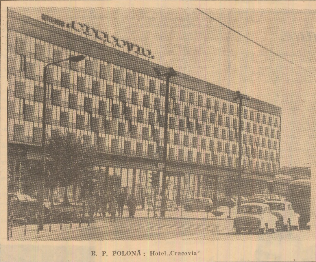
R. P. POLONĂ: Hotel „Craevia”

NEW YORK 8 (Agerpres). — Reuniunea Consiliului de Securitate, prevăzută să aibă loc marți pentru a relua dezbaterile pe marginea plîngerii Libanului împotriva atacului israelian de la sfîrșitul săptămîinii trecute, a fost amînată sine die. După cum s-a mai anunțat, Consiliul de Securitate a adoptat sîmbătă o rezoluție prin care cerea Israelului să-și retragă imediat forțele de pe teritoriul libanez.