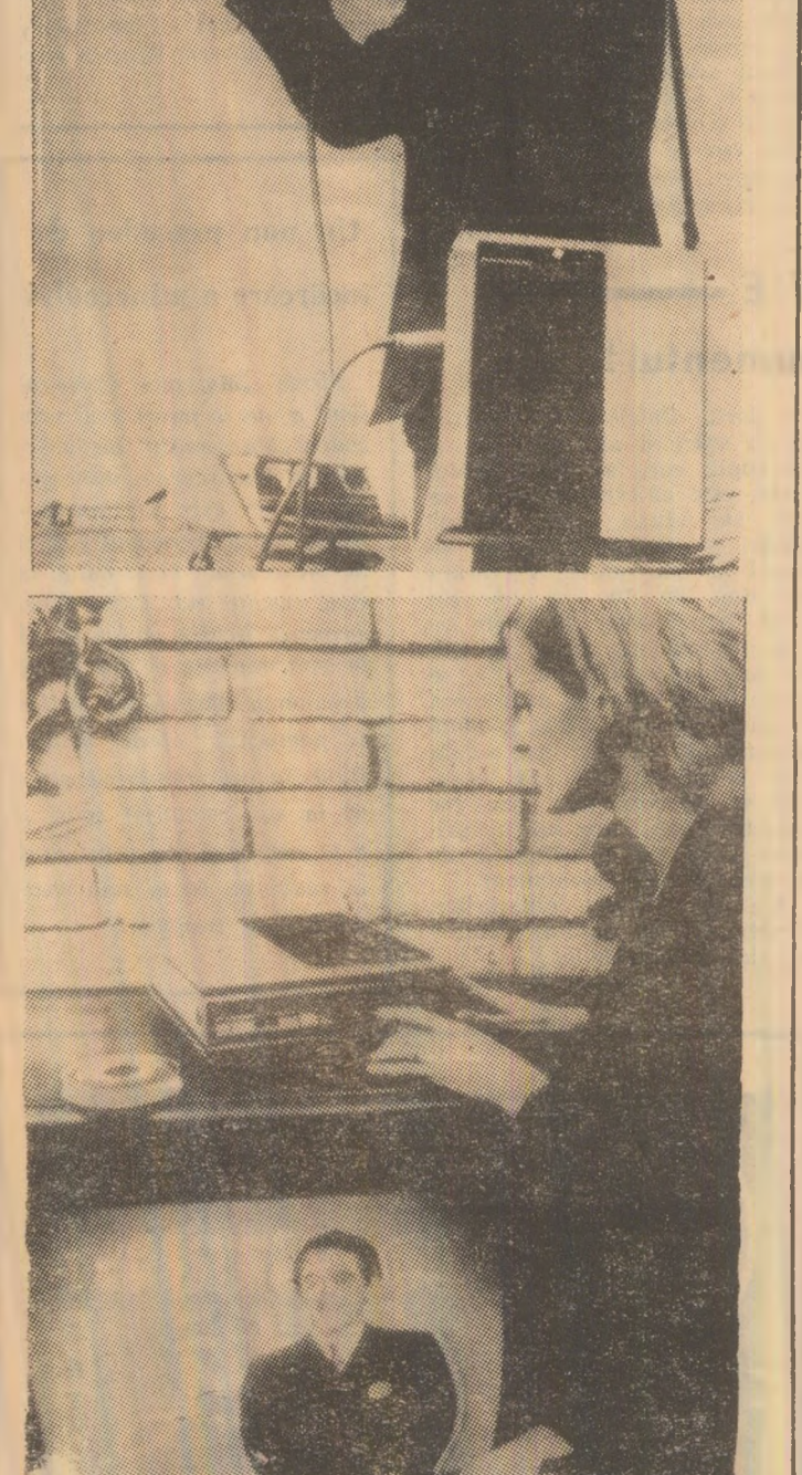
JAPONIA: Instalation este denumirea celui mai mic model de magnetofon — televizor, măsurînd 28 cm lățime, 33 lungime și 11 cm înălțime, în greutate de numai 7 kg, realizat de întreprinderea de produse electrice japoneze Toshiba. Prototipul sa fi pus pe piața la jumătatea anului viitor. Prin sistem amplex au fost realizate imagini cu cîntărețul respectiv imprimat pe bandă de magnetofon și în momentul cuplării cu ecranul de TV, muzica reproduce imaginea cîntărețului preferat. În foto: Noul produs magnetofon-televizor, realizat de firma Toshiba din Japonia.

În ajunul ședinței de deschidere a Săptămîni medicale balcanice, duminică după-amiază, a avut loc cea de-a 12-a reuniune a Consiliului general al Uniunii Medicale Balcanice, în cadrul căreia prof. M. Popescu-Buzeu a prezentat raportul anual de activitate al Consiliului. În încheierea dezbaterilor, Consiliul a aprobat raportul și a reînnoit mandatul secretariatului general pe o nouă perioadă de șase ani.