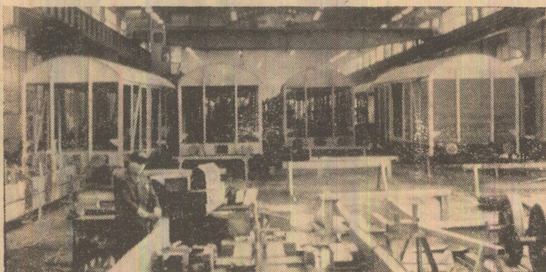
Hața de montaj a Uzinei de vagoane din Turnu Severin