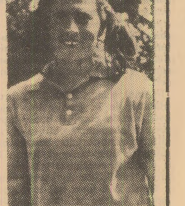
victorie din acest campionat, la care eu am contribuit cu 10 goluri.

— Desigur, mi-a răspuns zîmbînd. E prima noastră