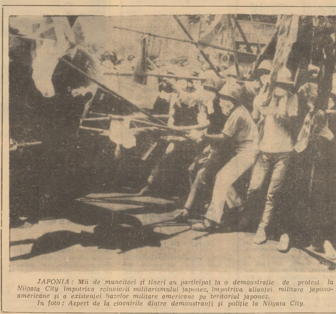
JAPONIA: Mii de muncitori și tineri au participat la o demonstrație de protest la Niigata City împotriva reînnoirii militarismului japonez, împotriva alianței militare japono-americane și a existenței bazelor militare americane pe teritoriul japonez. În foto: Aspect de la ciocnirile dintre demonstrații și poliție la Niigata City.