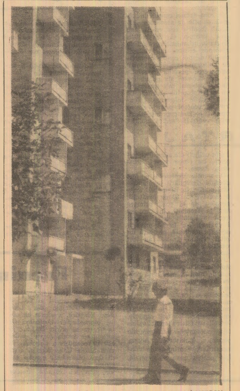
Măreție urbanistică.

27 MAI. Ne-am trezit într-un tîngaj de cosmar. Apa înundase piroa și pupa dar se retrăcea printre țijele de papirus.