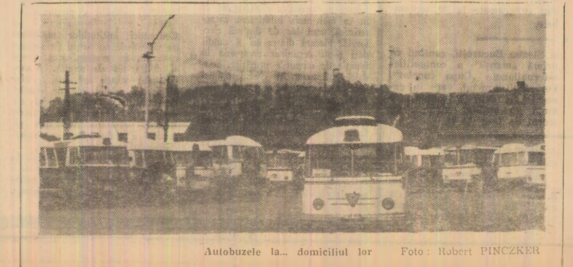
Autobuzele la... domiciliul lor

VINERI 18 SEPTEMBRIE PROGRAMUL 1: 5,05—6,00 Muzica dimineții; 6,05—9,30 Mu-zică și actualități; 7,00 Radio-Jurnal; 9,30 Ateanu; 10,10 Curs de limba spaniolă; 10,30 Succese ale muzicii ușoare; 11,05 Ariei din opere; 11,30 De față pentru toți; turșii; 11,45 Sfatul medicului; 12,00 Din fol-clorul muzical al popoarelor; 12,15 Popuriuri de muzică u-soră; 12,25 Știința la zi; 12,30 Întîlnire cu melodia populară și interpretul preferat; 13,00 Radiojurnal; 13,10 Avanspremieră cotidiană; 13,22 Din creația compozitorului Nicolae Kircu-lescu; 13,45 Barită; 13,52 discogra-fie; 14,00 Roza vînturilor; 14,25 Selecțiuni din operața „Rumoa-sa mea” de Loewe; 14,40 Publi-citate radio; 15,00 Concursul și festivalul internațional „Geor-ge Enescu”; 15,45 Melodii din filme; 16,00 Radiojurnal; 16,30 Melodii de cîrînd lansate; 16,45 Muzică de promenață; 17,05 Pentru patrie; 17,35 Concert de muzică populară; 18,00 Recital de operetă; 18,10 Revista eco-nomică; 19,00 Gazeta radio; 19,30 Din tezaurul folclorului nostru muzical; 20,05 Tableta de seară; 20,10 Microrecital Julie Driscoll; 20,20 Argeșeziana; 20,25 Zece melodii preferate; 21,00 Ateanu; părinți; 21,20 Cîntă Slava Przybylska; 21,30 Moment poetic; 21,35 Solistul scrii: Aurelian Andreescu; 22,00 Radiojurnal; 22,20 Sport; 22,30 Jazz; 23,00 Concert de muzică ușoară; 0,03—3,00 Es-tuadu nocturnă.