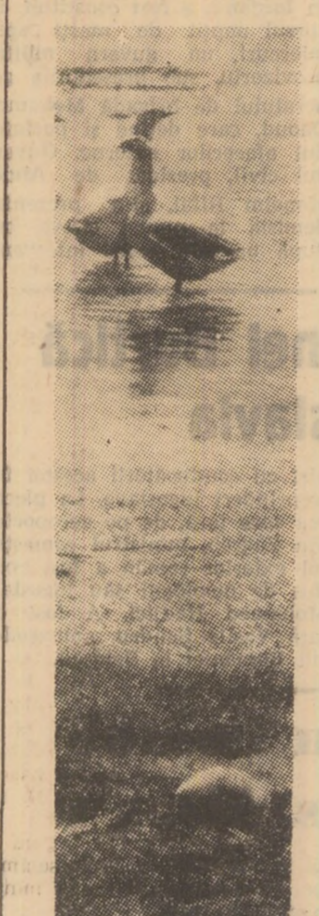
Toamna, se numără...

Poate că nu întotdeauna mem-brii echipelor de control obștesc procedază în modul cel mai corect în activitatea lor; poate că nu toți membrii echip-elor de control obștesc sînt foarte competenți să exercite asemenea controale dar, în general, oamenii au ales în aceste organisme pe cei mai corecți și sinceri „olegi de muncă și organizațiile comerciale au da-toria să-i ajute în activitatea lor, să le expună greutățile pe care le au, cauzele care gene-rează aceste greutăți, să încere-impreună să lihidzeze orice lipsuri întru mulțumirea gene-rală a populației. Echipole de control obștesc sînt niste orga-nisme bine determinate, alese de cetățenii pentru a apăra in-teresele cetățenilor. Ele trebuie să-și exercite în mod riguros obligațiile, iar unitățile comer-ciale să le acorde tot sprijinul.