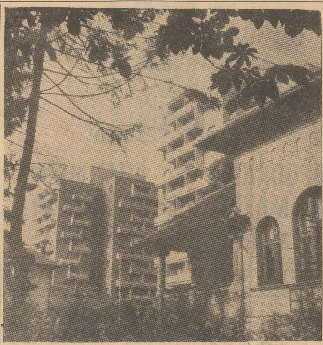
Ingemănare de pitoresc natural și fantezie urbanistică

Studiul individual, formă superioară a învățămîntului de partid. Teodor RUSU, Director al Cabinetului municipal de partid (Continuare în pag. a 3-a)