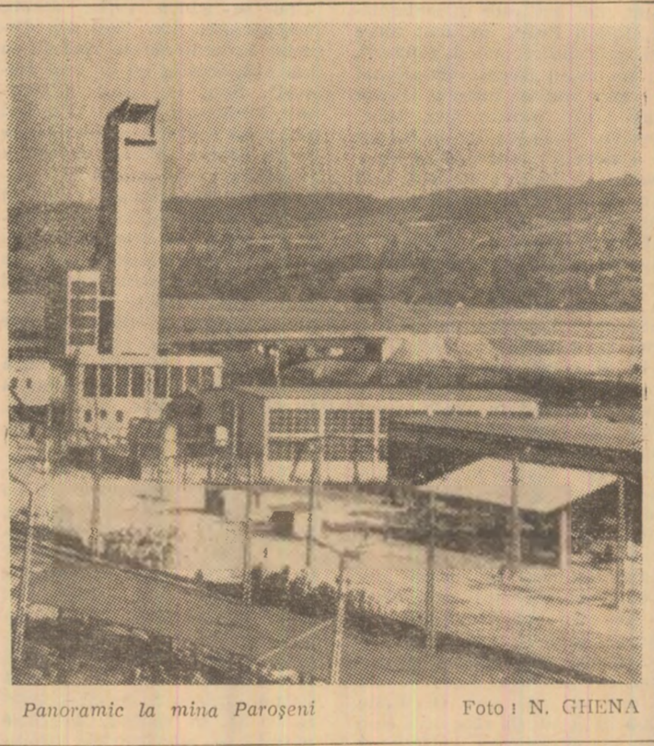
Panoramic la mina Petroșani