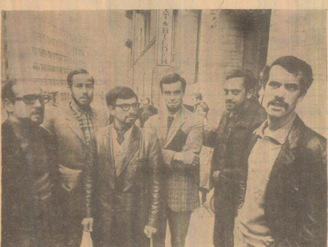
SUEZIA: O parte a opiniei publice portugheze a devenit conștientă de faptul că războiul colonial din Portugalia este o activitate de natură să prejudicieze securitatea statului. Printre acuzații se află faptul că ministrul Stephane Bongo Nouara, care a fost condamnat la 10 ani închisoare.

BERLIN 24 (Agerpres). — Republica Democrată Germană a adresat UNESCO un memorandum privind cererea sa de a deveni membră a acestei organizații, anunțată agenția ADN. Guvernul R.D.G. se arată în memorandum, este gata să-și ocupe locul în UNESCO cu toate drepturile și îndatoririle ce-i revin. În memorandum sunt subliniate realizările științifice și culturale obținute de R.D.G., relațiile ei în continuă dezvoltare cu numeroase țări ale lumii. Este subliniat, de asemenea, faptul că organizații și personalități ale R.D.G. din domeniul științei și culturii sunt reprezentate sau fac parte din aproape 500 de organizații internaționale, multe dintre acestea depinzând de UNESCO. În memorandum se arată că cererea R.D.G. de a fi primită în UNESCO răspunde spiritului colaborării internaționale și principiului universalității, caracteristice acestei organizații.