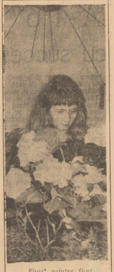
„Flori” printre flori