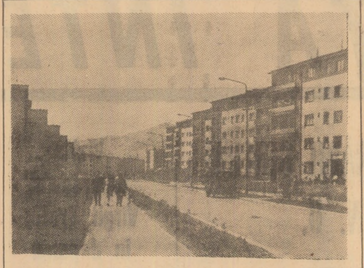
Cartierul „8 Martie” din Petrila