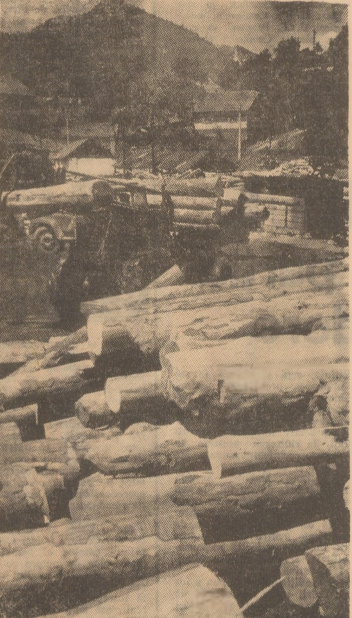
Unul din locurile terminus de materializare a produciei la exploatarea lemnului și în transportul forestier — depozitul final din gară mică Petrosani.

Din partea U.E.L. Petrosani au fost sesizări privind unele deficiențe interne ale U.M.T.F., privind activitatea de transport? — Au existat, desigur, și unele lipsuri proprii în ceea ce privește menținerea parcului din dotare în condiții tehnice corespunzătoare, datorită faptului că zecerea tehnică menținută de la U.M.T.F. Sebeș a fost de slabă calitate, atelierul central de reparații, bine utilat, rămânând la fostul U.M.T.F. Sebeș.