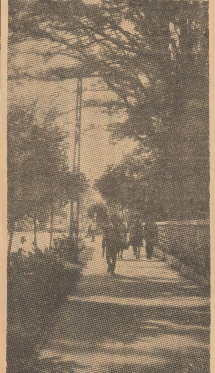
Reflexe de amiază

In goana nebună spre celălalt capăt al firului, capăt care se pierde în neant, uităm, orînd-nevînd, de trecerea timpului. Doar la cîte un solștițiu opriți, parcă, cu o gîndire, să aibă timp priverii să cuprîndă sîrîntul unui tablou și începutul celuilalt, cu toate că ele se succed din timpuri fîră de margini. Din nesat, invadate sau neputîndă ni se pare de fiecare dată mai ațel pentru că nu s-am pătruns tainele. I-am citit pe Platon, Montaigne, Lukacs și pe Morris și totuși tresăli din încrengamă hîmă la atingerea unei flori, unui rod dat în pîrg. De unde atîc echilibrul, atîcă perfectiunea, atîcă puterea de sinteză? Va reuși, oare, omul să forțeze cheie din razele soarelui, cu care să pătrundă în labirinturile începutului? M-e teamă să spun, dar simt că am aflat una din marile taine: la început a fost toamna, altmînter Natura n-avea de unde să-și procure culorile. T. KARPATIAN