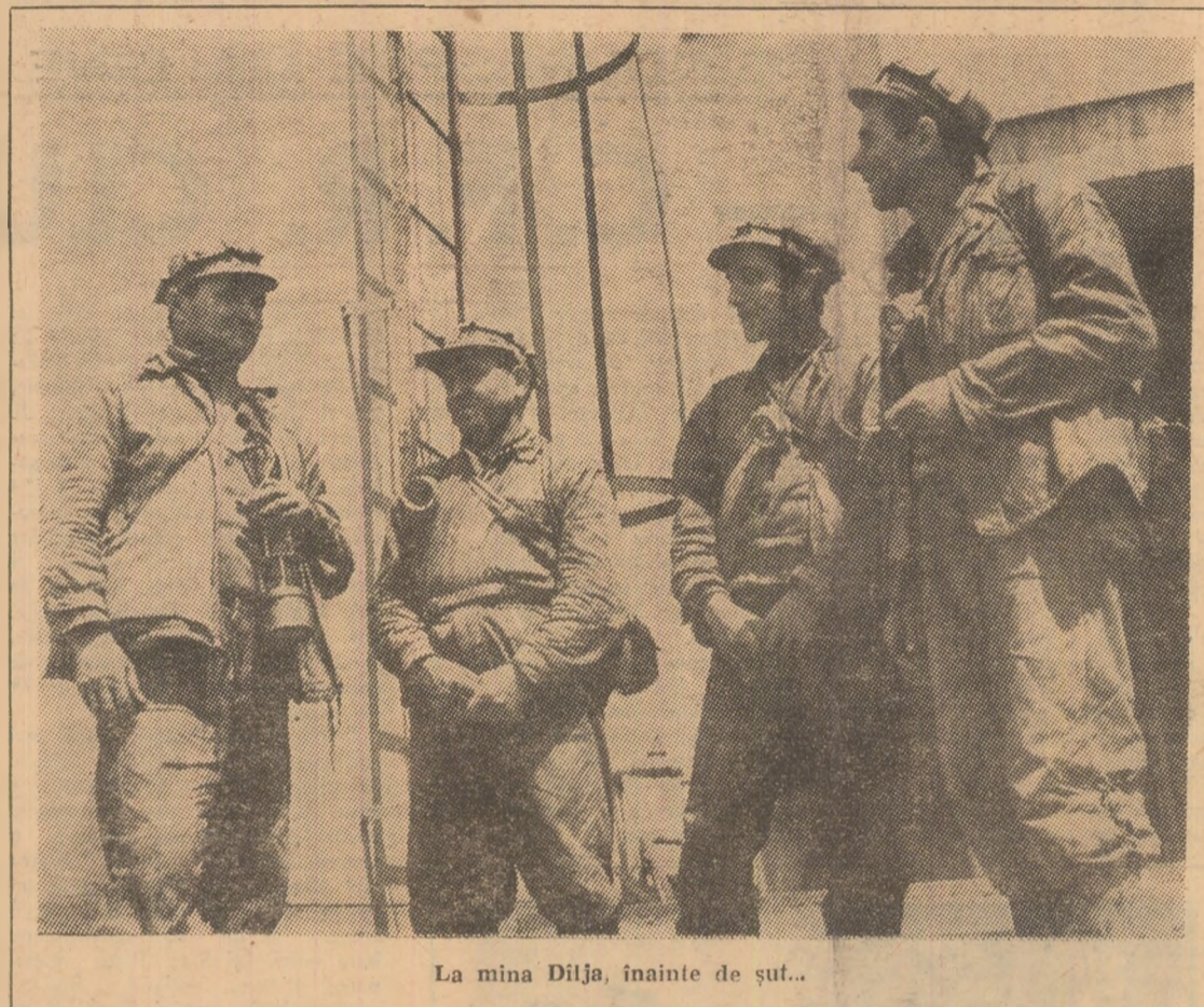
La mina Dilja, înainte de sut...