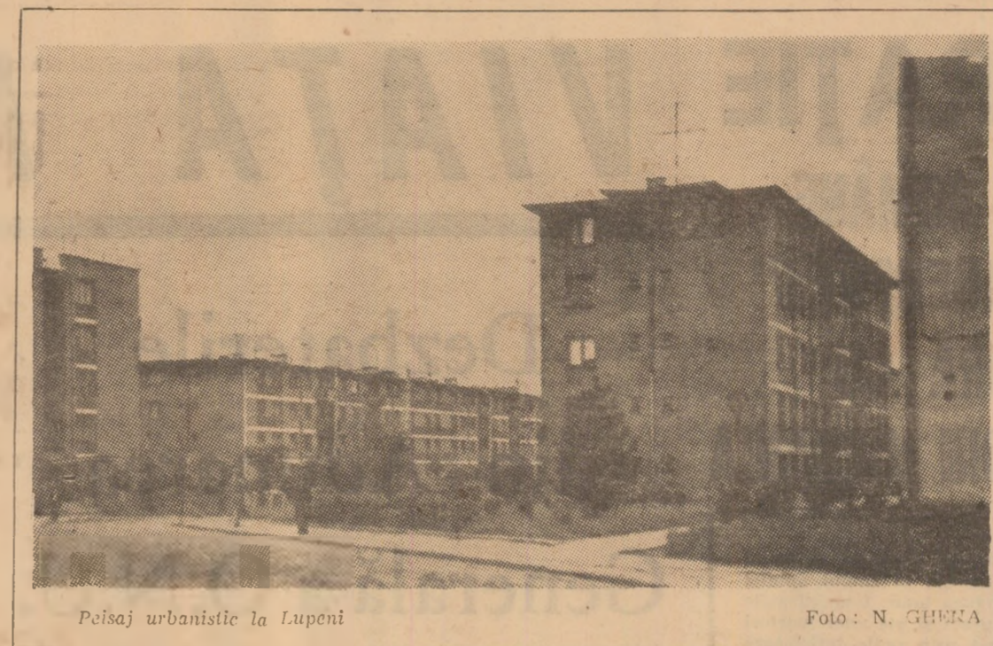
Peisaj urbanistic la Lupeni

VIND aragaz, butelie, mobilă combinată, frigider Alka, pian Stingl scurt. Str. Unirii bloc. 22, sc. 1, ap. 10.