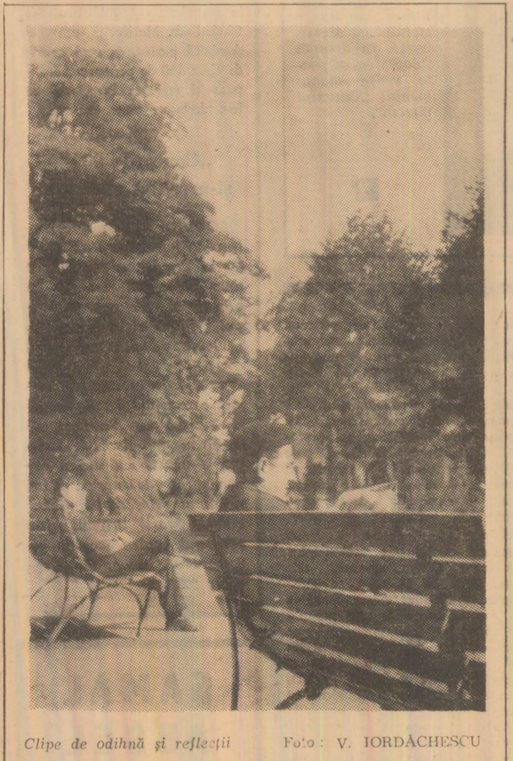
Clipe de odihnă și reflecții

Este desigur o dorință ușor de realizat atunci cînd există preocupare sporită în acest sens. Sperăm că în cele din urmă „Unirea” să cucerească un bun renume prin prestarea unor servicii de cea mai bună calitate. Tineretea ei îi poate asigura perspective din cele mai frumoase.