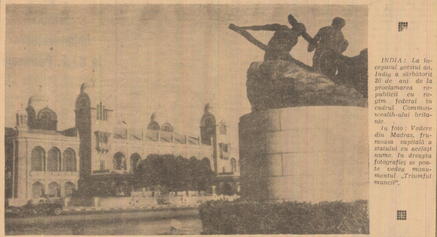
INDIA: La începutul acestui an, India a sărbătorit 20 de ani de la proclamarea republicii federale în cadrul Commonwealth-ului britanic. În foto: Vedere din Madras, frumoasa capitală a statului cu același nume. În dreapta fotografia se poate vedea monumentul „Triumful muncii”.

PNOM PENH 28 (Agerpres). — Forțele Frontului Național Unit din Cambodgia au atacat fortificațiile deținute de trupele regimului Lon Nol la nord de orașul Battambang — relatează agenția France Presse. După lupte violente, patrioții cambodgieni au ocupat o importantă poziție în interiorul acestei localități, provocând înamicilor pierderi grele în oameni și echipament militar. Totodată, forțele de rezistență populară au eliberat aproximativ 40.000 de persoane dintr-un lagăr la concentrare creat de administrația Lon Nol în sectorul Battambang. Pe de altă parte, localitatea Taing Kauk, situată la 75 kilometri nord de capitala khmeră, continuă să fie scena unor lupte îndrăgite între detașamentele patrioților și efectivele militare ale regimului de la Pnom Penh. Patrioții își mențin controlul asupra șoselei numărul șase ce trece prin Taing Kauk, iar toate încercările făcute până acum de unitățile militare inamice de a înainta în direcția orașului Kompong Thom, încercuit de peste 60 de zile de forțele de rezistență populară, au eșuat până în prezent.