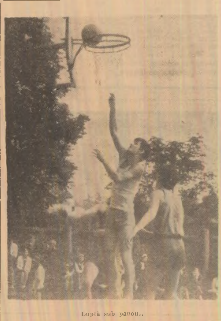
Luptă sub panou...