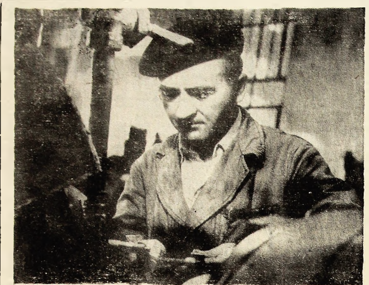
Rectificatorul Rusoim Bota de la U.U.M.P. în timp ce măsoară o piesă care urmează să fie montată la transportorul TR 2.

ORGAN AL COMITETULUI MUNICIPAL PETROȘANI AL P.C.R. ȘI AL CONSILIULUI POPULAR MUNICIPAL