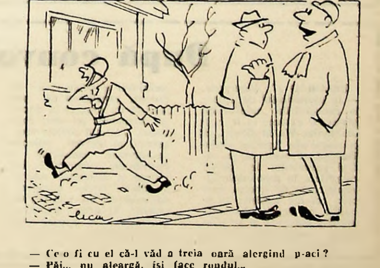
— Ce o fi cu ei că-l văd a treia oară alergînd p-ac? — Păi... nu a alergat, își face rondul...