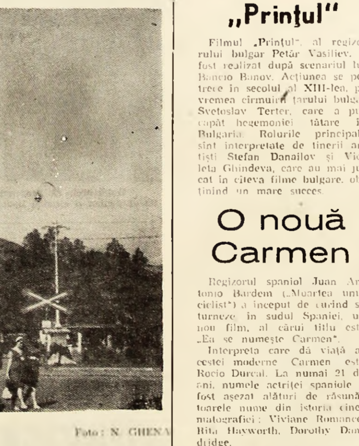
București, Palatul Dunării

șietoare dintre gînd și faptă. Ca legendarul Pan care înălță în zborul gravitatei ale năului zbuciumat dionisiac al trăirii naturiste, sau ca Orfeu ce vrăjea nu numai pe Euridice ci și pe toată lumea, Blaga compune melopeea gravă a creatorului într-un mediu tipic spațial.