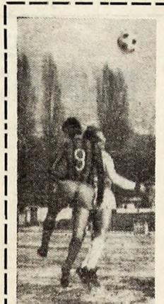
Pagina a 2-a