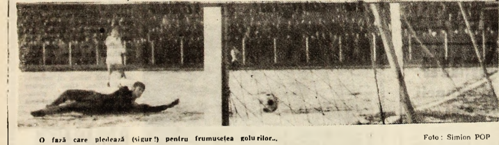
O fază care pledează (sigur!) pentru frumusețea golurilor...

Sub conducerea comitetelor de partid, comitetelor sindicatelor și a celor ale asociațiilor sportive pentru pregătirea și desfășurarea adunărilor și conferințelor sportive.