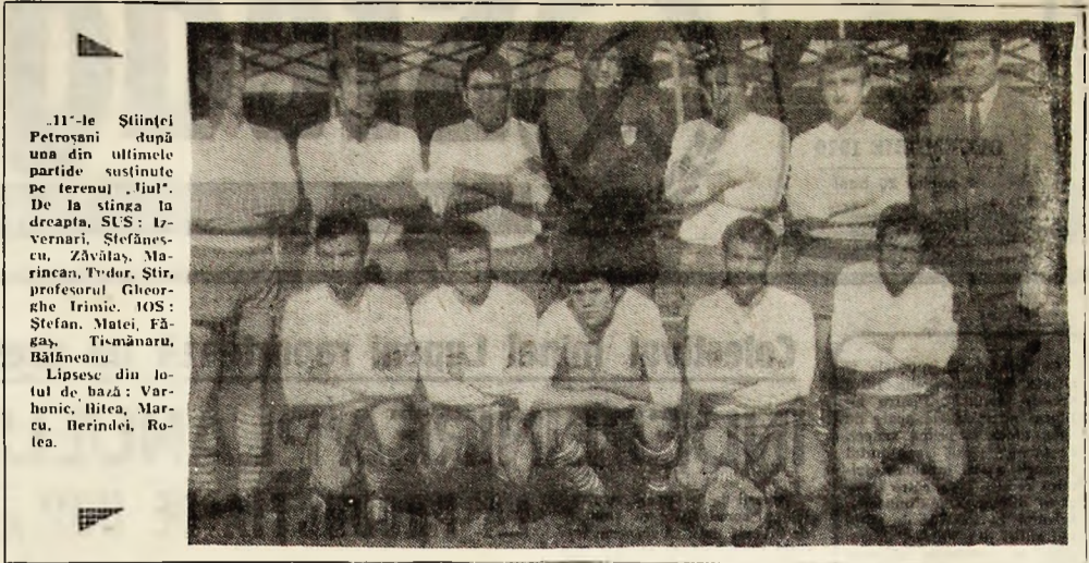
Știința Petroșani după una din ultimele partide sustinute pe terenul „Iul”.