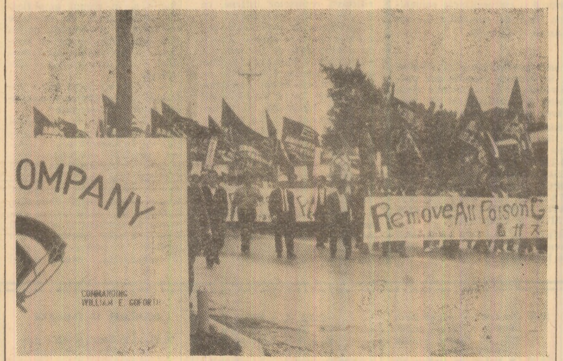
Populația din Okinawa cu steaguri și pancarte s-a îndreptat spre baza militară americană Koza, cerînd evacuarea tuturor armelor chimice din insulă. În foto: Demonstrații îndreptîndu-se spre baza militară americană Koza.

Încheiere, ziarul subliniază necesitatea ca Statele Unite să înceadă a mai sprijini regimul ciankaișt, arătînd că „problema Taiwanului este esențialmente o problemă chineză și că ea poate fi soluționată numai de chinezi”.