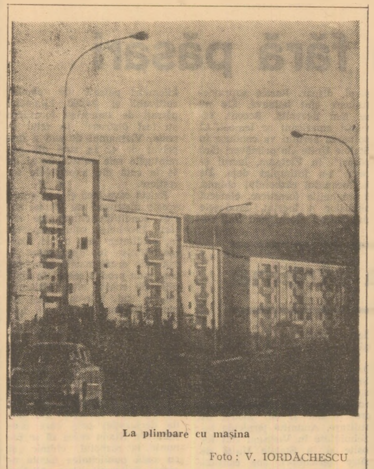
La plimbare cu mașina