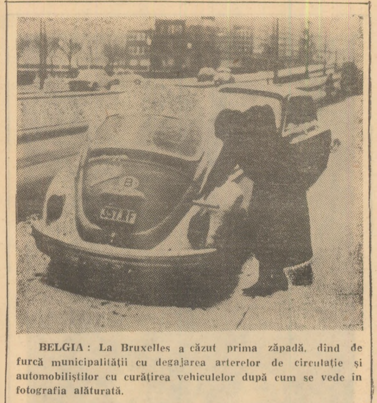
BELGIA: La Bruxelles a căzut prima zăpadă, dînd de furcă municipalității cu degajarea arterelor de circulație și automobilisților cu curățirea vehiculelor după cum se vede în fotografia alăturată.