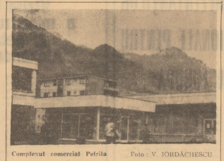
Complexul comercial Petrița