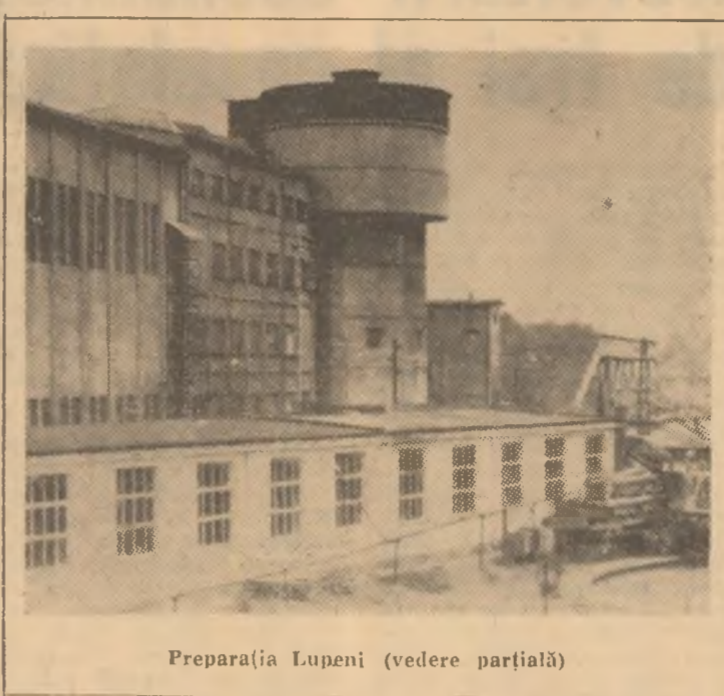
Preparația Lupeni (vedere parțială)