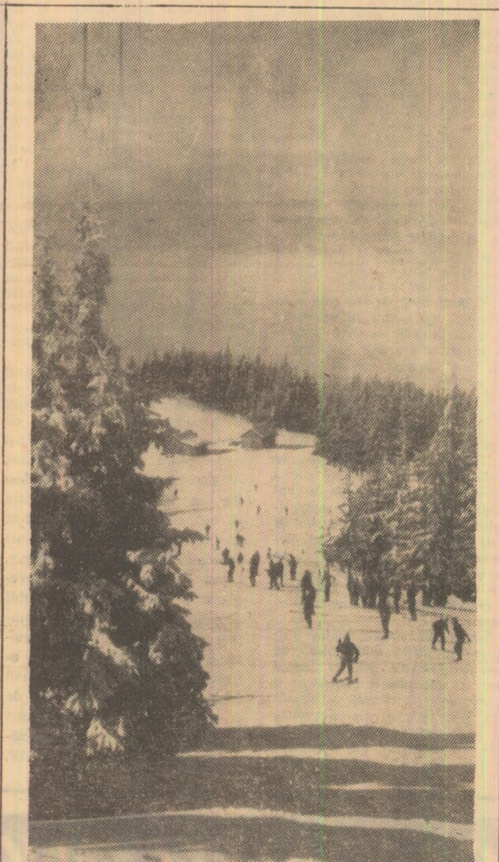
Pe pirtile din Paring

● Integrarea profesională a noilor angajați — proces care nu se rezolvă de la sine.