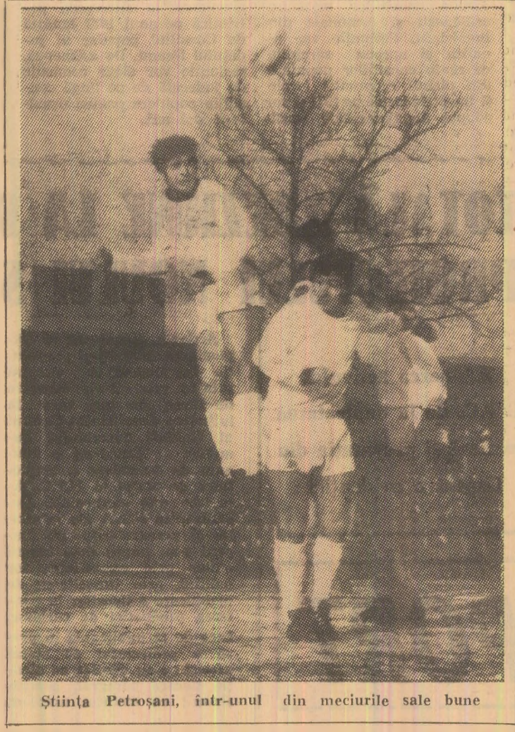
Știința Petroșani, într-unul din meciurile sale bune

După cum lesne se poate observa, în unele ramuri sportive rezultatele au fost modeste, mult sub posibilitățile existente. Una dintre cauzele principale ale acestei stări de lucruri este slaba preocupare a unor membri ai birourilor secțiilor respective, care s-au mul-