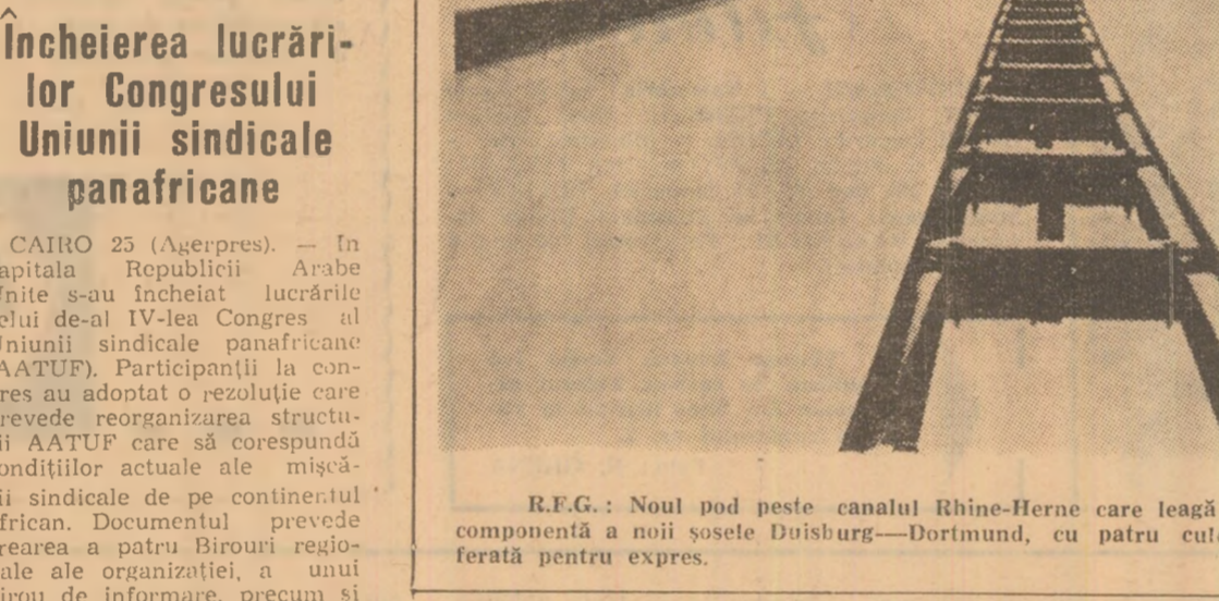
R.F.G.: Noul pod peste canalul Rhine-Herne care leagă orașele Bottrop și Essen, parte componentă a noii sosele Duisburg-Dortmund, cu patru culoare pentru automobile și linia ferată pentru expres.

CONAKRY 25 (Agerpres). — După reuniunea extraordinară a Adunării Naționale a Republicii Guineea, constituită în tribunal revoluționar suprem, la Conakry a avut loc, în prezența lui Ismail Turé, membru al Biroului Politic al Partidului Democrat și ministrul dezvoltării economice, un miting în cursul căruia purtătorul de cuvînt al Adunării Naționale a comunicat hotărîrea adoptată de Tribunalul revoluționar suprem. El a precizat că printre persoanele condamnate la moarte figurează șase portughezi, șapte foști miniștri guineezi, precum și un fost reprezentant permanent al Guineei la O.N.U. Toate bunurile mobile și imobile ale acuzatilor au fost confiscate.