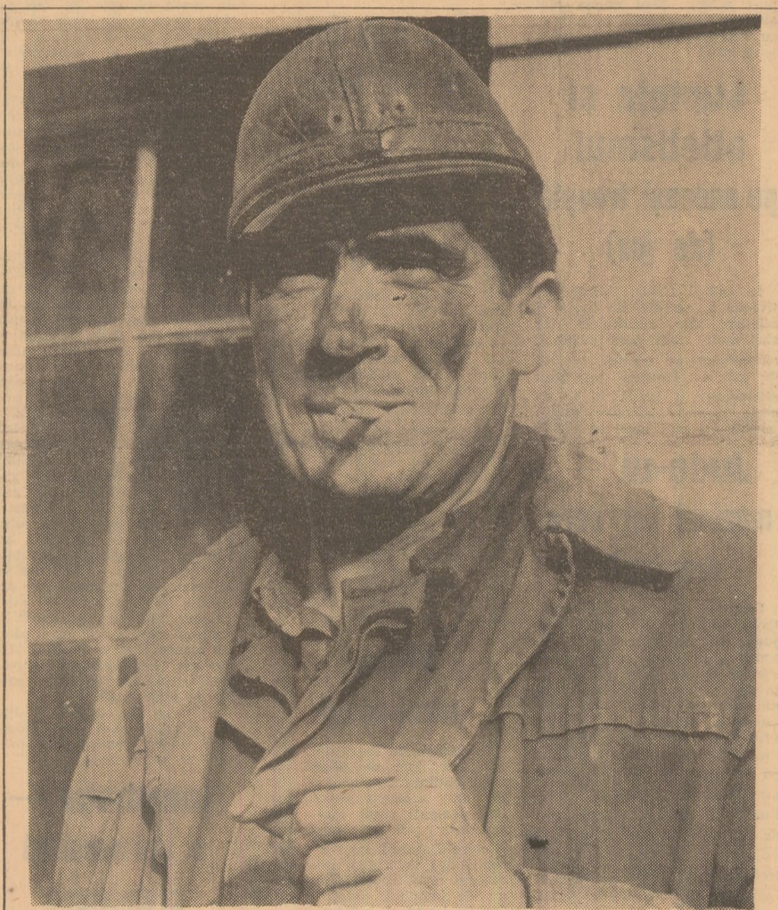
Minerul Ioan David de la mina Aninoasa după un șul rodnic.