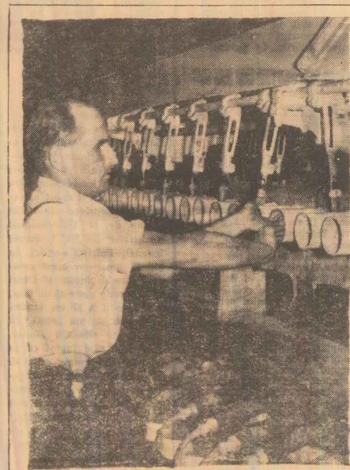
În secția a doua — filatură a „Viscozei”