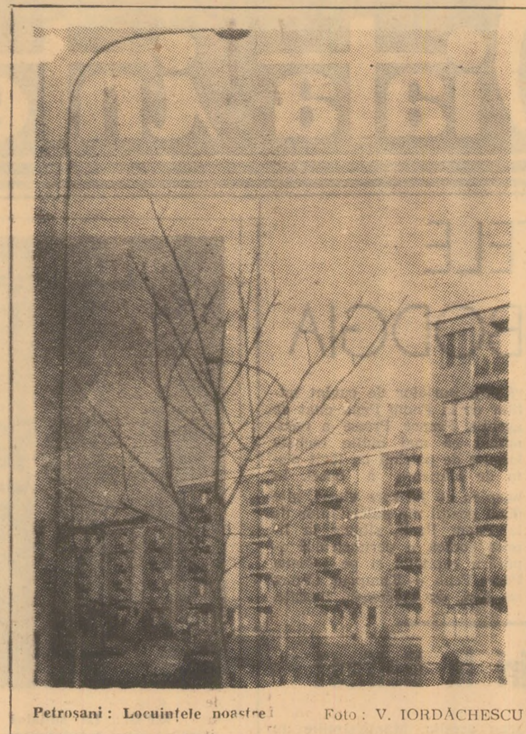
Petrosani: Locuințele noastre

Vă urez dumneavoastră și tuturor lucrătorilor din comerțul exterior mult succes în activitatea viitoare, multă sănătate! (Aplauze puternice, prelungite).