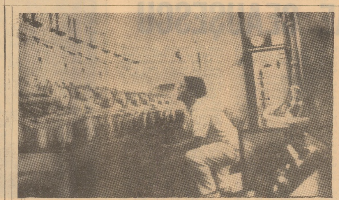
R.F.G.: La spitalul Friedrichshain din Berlin a fost instalat la sfîrșitul anului 1969 un centru pentru transplantarea rinichilor. Pînă în prezent, aici s-au efectuat 26 operații de transplantare. Astfel tratamentul bolnavilor se face prin două metode: 1. dialize permanente cu ajutorul rinichiului artificial, 2. transplantul. Rinichiul artificială lucrează pe principul dializei: substanțele conținute în urină trec din singele bolnavului printr-o membrană foarte subțire într-o soluție salină. În cazul primei metode pacientul trebuie conectat de 2-3 ori pe săptămîna la mecanismul de rinichi artificiali. În cazul unui transplant de rinichi reușit se realizează o reabilitare relativ rapidă a pacientului făcîndu-l independent de orice aparate. În foto: Controlul tehnic al rinichiului artificial.

NEW YORK 5 (Agerpres). — Joi, a avut loc o nouă reuniune a reprezentanților la O.N.U. ai Uniunii Sovietice, Marii Britanii, Franței și Statelor Unite.