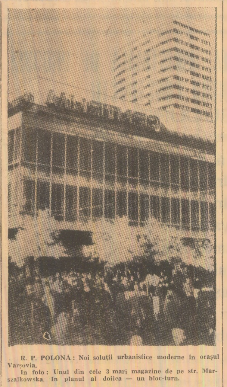
R. P. POLONĂ: Noi soluții urbanistice moderne în orașul Varșovia. În foto: Unul din cele 3 mari magazine de pe str. Marszałkowska. În planul al doilea — un bloc-torn.

vește aviația comercială, peste 200 de companii utilizează aparate dotate cu motoare de aceeași fabricație. Vestea dificultăților prin care trece renumita firmă britanică a provocat îngrijorări și în alte capitale ale Europei occidentale. Se amintește în acest sens că o eventuală dispariție a companiei „Rolls-Royce” va da o lovitură gravă colaborării vest-europene în domeniul aeronauticii, începută cu altă tîrziu prin proiectul franco-britanic „Concorde”. Săptămîna viitoare, Camera Comunelor urmează să ia în discuție un proiect de lege care să autorizeze guvernul de a pune în practică o serie de măsuri. De asemenea, guvernul britanic a hotărât să inițieze „consultări urgente” cu societatea americană „Lockheed” și cu Administrația Statelor Unite.