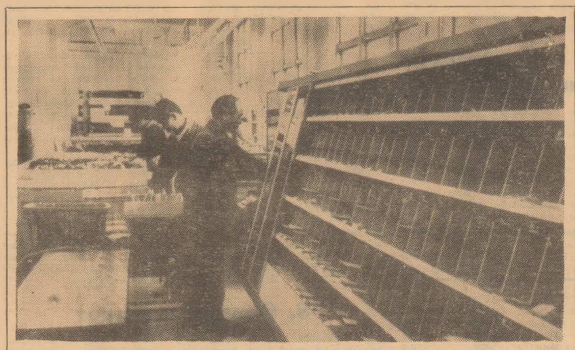
JAPONIA: La serviciile postale din Japonia volumul expeditiilor a crescut considerabil în ultimii ani. Pentru a ușura munca funcționarilor au fost introduse la oficiile poștale o serie de mașini automate.

avut loc în orașul Boston, La Baltimore, între demonstrații și poliție s-au produs ciocniri soldate cu rănierea mai multor persoane.