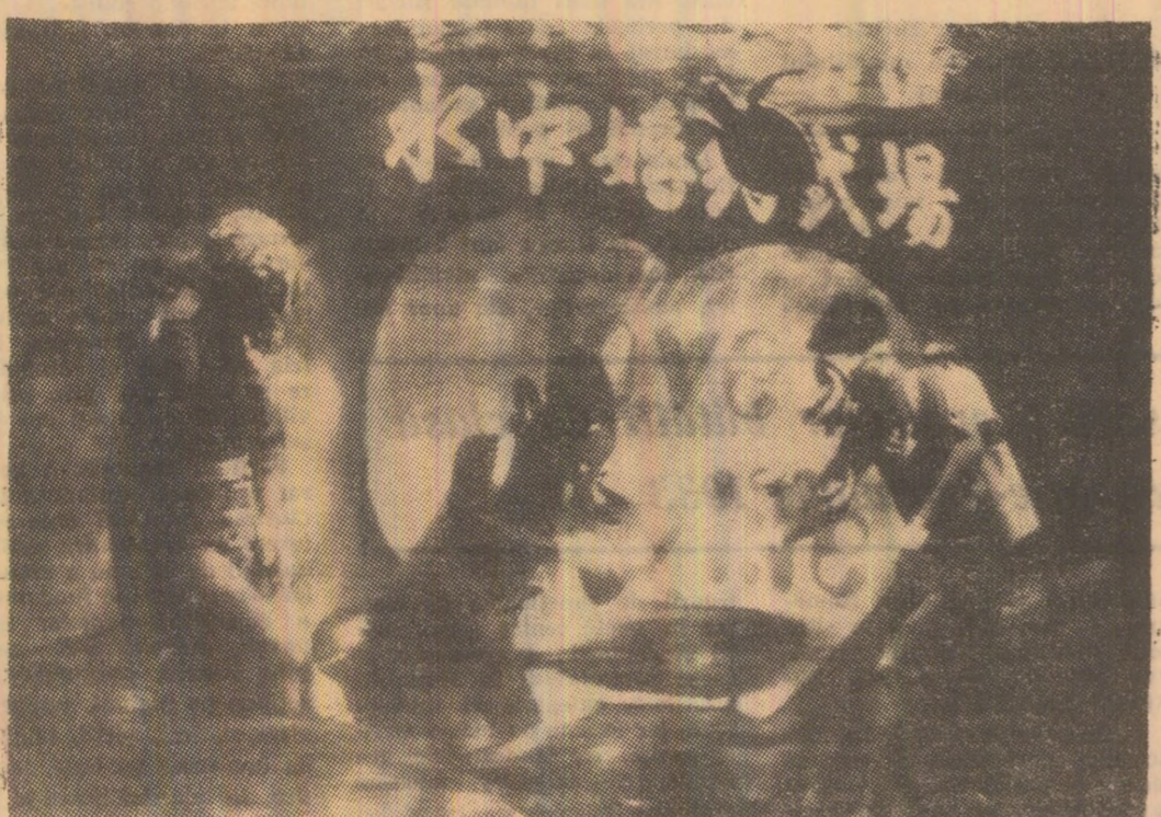
Recent, în localitatea Takamatsu, Insula Shikoku — Japonia, s-a celebrat o căsătorie ciudată, care a avut loc într-un acvariu. Ideea a fost a miresei, care a afirmat că a vrut să știe mai multe despre munca viitorului său soț care lucrează la aceste acvarii. În foto: Cîndata ceremonie din interiorul acvariuului.

Stă într-un fotoliu imens, nemșecat, imper turbabil, Picbarele, abia li a jung la pămînt. Ține în mîinile înecucite pe burta în formă de ou în poziție de Buda, element constitutiv al legendei sale. Are acum 71 de ani și pare tot mai rotund, tot mai mic. Dar fața lui rozalie, brăzdată de două cute de malicie nu și-a pierdut nimic din jovialitatea în care se amestecă umorul pur și o tentă de cabină.