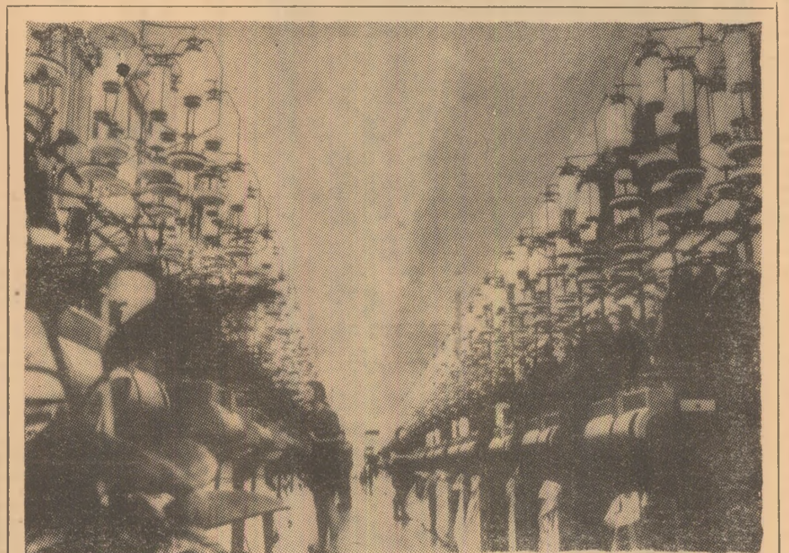
R. D. GERMANĂ: La Combinatul de corapi ESDA din Auerbach, creșterea producției muncii este determinată în egală măsură de o tehnologie modernă, automatizată întregului proces de producție, ca și de condițiile sociale excelente create aici. Vechile depozite au fost amenajate pentru a servi ca grădinițe pentru copiii salariaților. Combinatul dispune și de un serviciu medical atent, de săli de producție luminoase și spațioase. În foto: Una din marile săli de producție ale Combinatului ESDA.