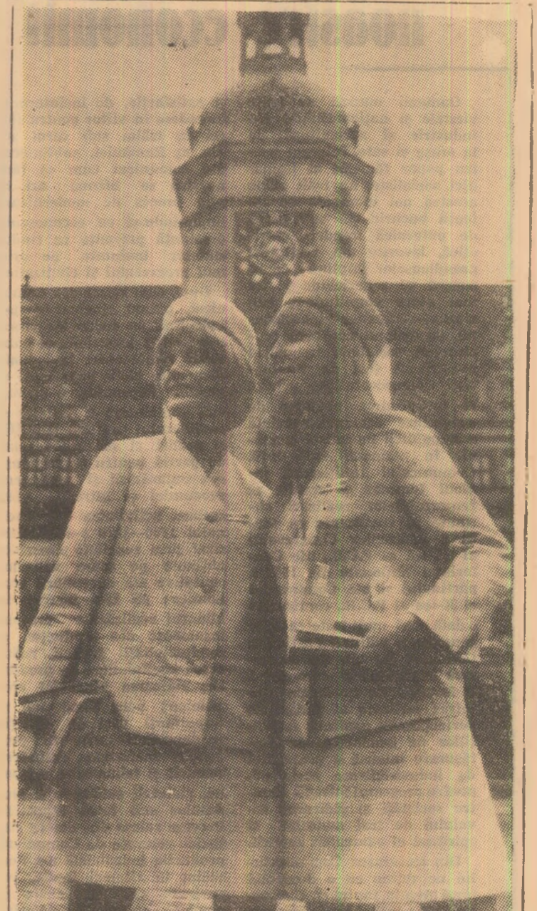
Tirgul internațional de primăvară de la Leipzig 1971 (14-23 martie) se apropie. În foto: Istoricul hotel al orașului, doi dintre numeroșii ghizi care vor conduce vizitatorii.

Alfred Hitchcock se amuză. Iar secretul său constă în faptul că turneză filme de 50 de ani, pentru că, acesta a rămas încă singurul mijloc de a povesti o întîmplare fără să fie întrerupt.