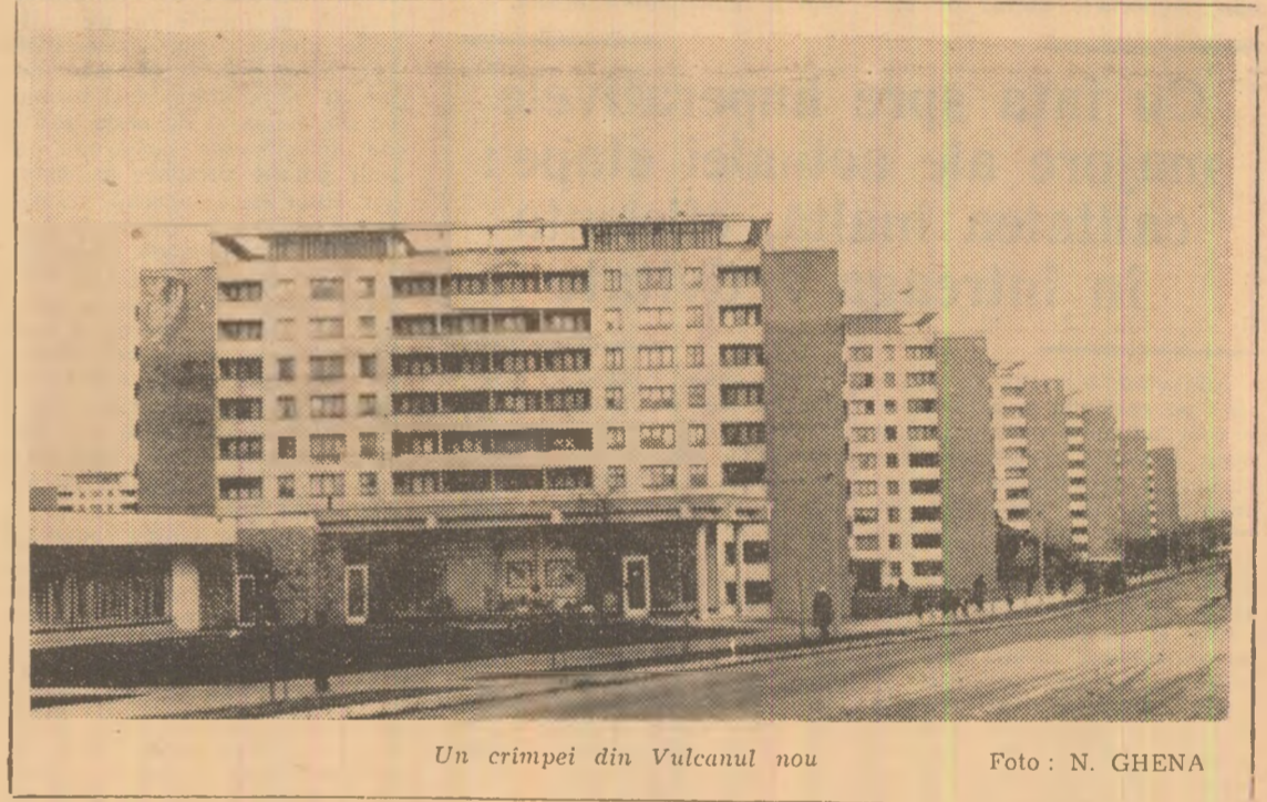
Un crîmpel din Vulcanul nou

IN PAG. A 4-A Comunicatul Consfățuirii miniștrilor afacerilor externe ai statelor participante la Tratatul de la Varșovia