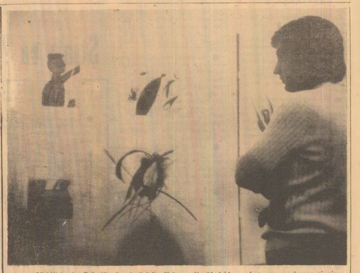
SPANIA: La Galerile de Artă Iolins-Velasco din Madrid au fost expuse desene și picturi aparținînd lui Eugue Ionescu, membru al Academiei franceze. În foto: Cîteva din tablourile expuse.