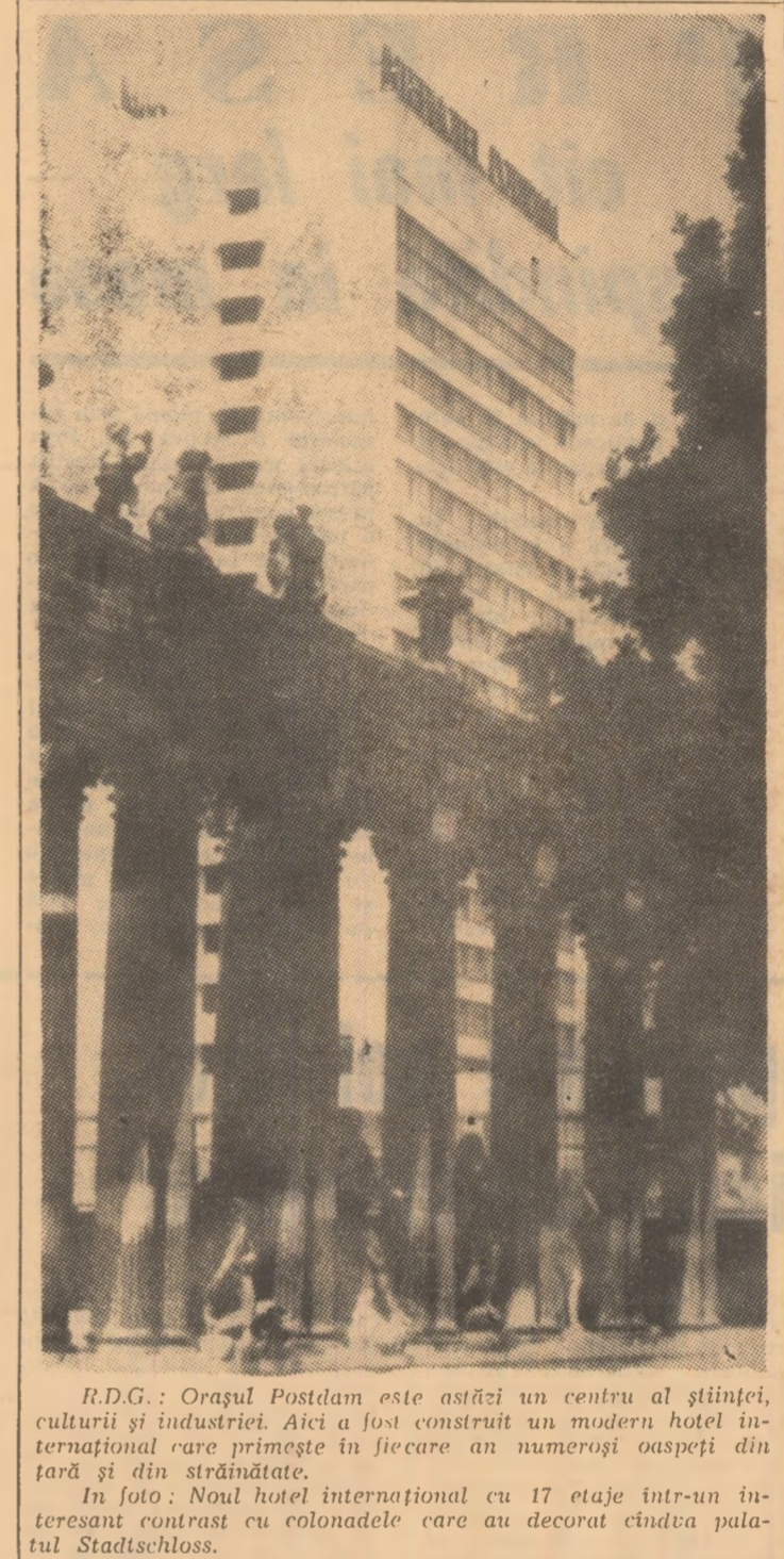
R.D.G.: Orașul Postdam este astăzi un centru al științei, culturii și industriei. Aici a fost construit un modern hotel internațional care primește în fiecare an numeroși oaspeți din țară și din străinătate.

Îndeplinirea cu succes a tuturor lucrărilor prevăzute de program a confirmat justetea soluțiilor tehnice și siguranța de funcționare a tuturor elementelor, sistemelor de bord și mijloacelor de comunicație ale aparatului selenar, cit și ale celor terestre.