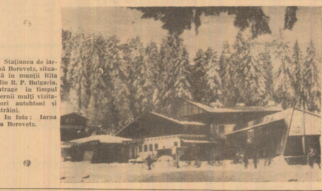
Stațiunea de iarnă Borovetz, situată în munții Rila din R. P. Bulgaria, atrage în timpul iernii mulți vizitatori autohtoni și străini.

cea de-a 27-a sesiune a Comisiei O.N.U. pentru drepturile omului. Dezbaterile vor fi consacrate, în principal, problemei discriminării rasiale din Republica Sud-Africană. Membrii comisiei vor examina, de asemenea, un raport special privind apartheidul și tratamentul aplicat deținuților politici din R.S.A., Rhodesia și coloniile portugheze din Africa.